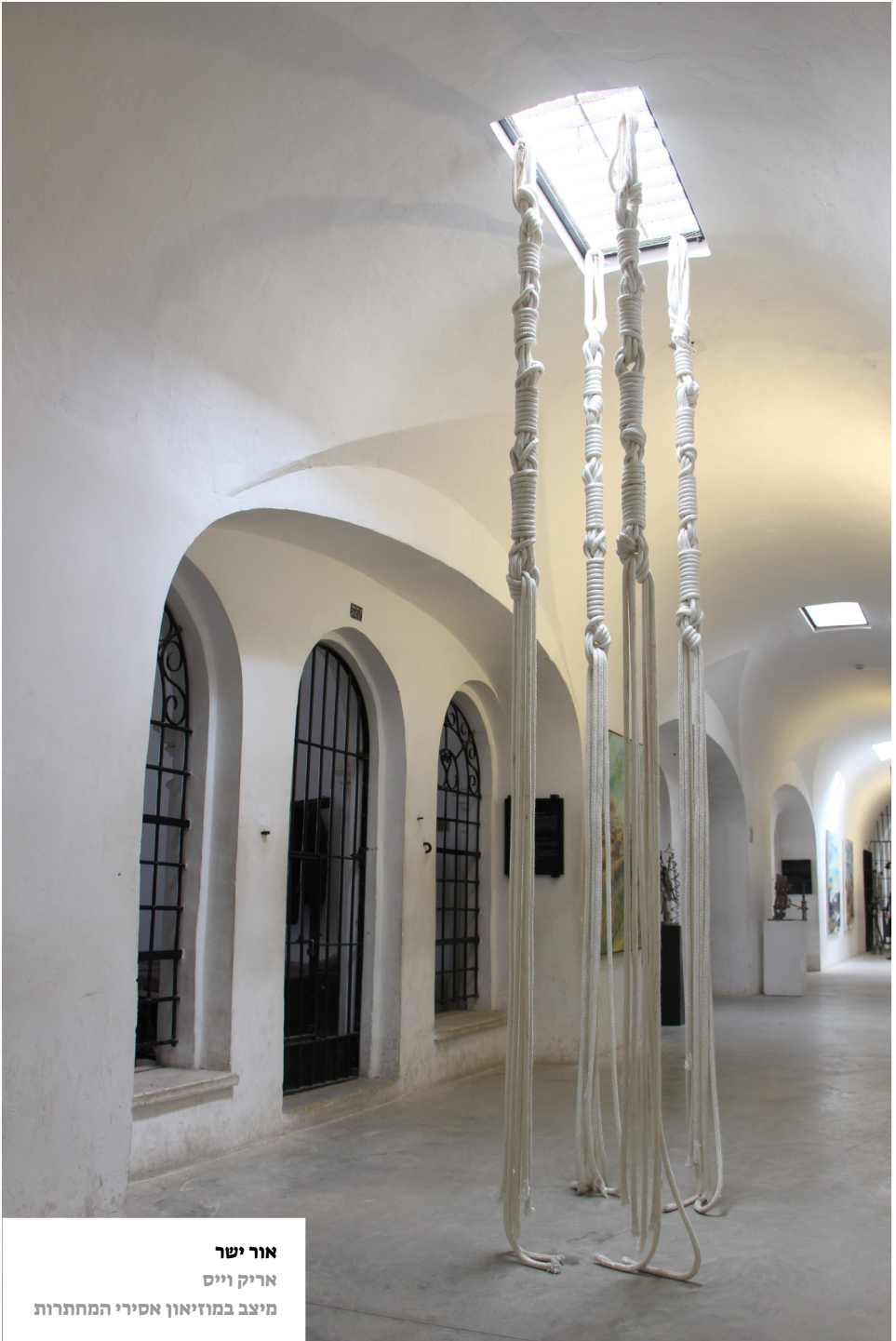
אור ישר אריק וייס מיצב במוזיאון אסירי המחתרות