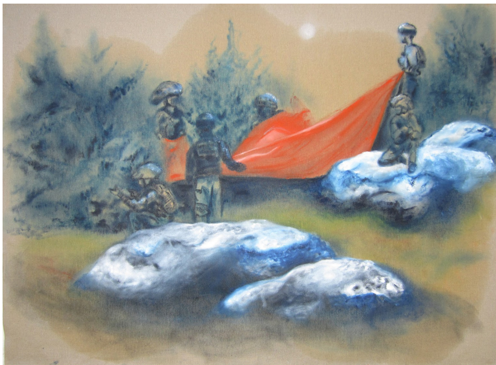
ללא כותרת (שיח, וריאציה 1) עוזיאל רנחל בוגר ישיבת מצפה רמון שמן על בד 90*120, 2017