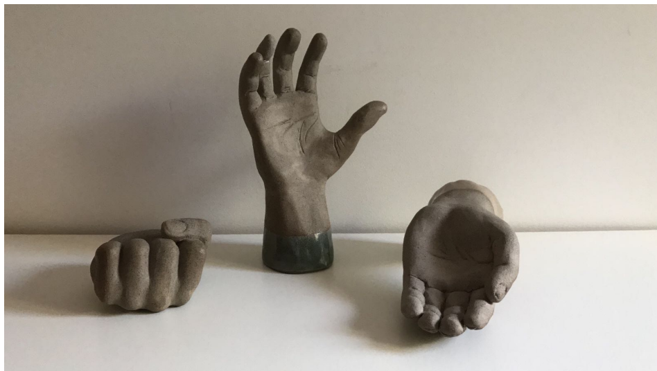
גם האגרוף היה פעם יד פתוחה ואצבעות אמתי ברנסקי, תלמיד בבית המדרש בראש פינה חימר שרוף וגלזורות