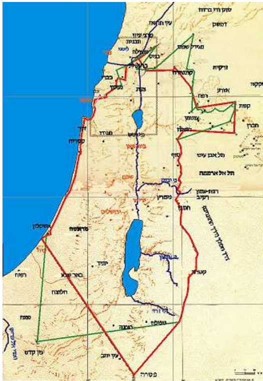
גבול עולי בבל לפי האנציקלופדיה התלמודית

לפי המתארים את הדרך היורדת מדמשק למכה, ברור שמדובר בקו גבול שעובר מצפון לדרום, וברור גם שלא נוכל לבאר שכל אורך הדרך הוא הגבול, מפני שאם אורך הדרך הוא הגבול - מדוע יש צורך בנקודות ציון נוספות? מספיק לומר שכל הדרך היא הגבול! ונראה לומר שבקטע מסוים סמוך לטרכיון (שמופיע קודם לכן ברשימת הירושלמי), הגבול היה הדרך הגדולה ההולכת למדבר. גם אם נסביר שהדרך הגדולה נמצאת בעבר הירדן המערבי (ליד אשקלון) ההסבר יהיה דומה, כי אי אפשר לומר שכל הדרך הזאת היא מכיבוש עולי בבל אלא רק קטע מסוים ממנה, ובה החזיקו עולי מצרים. בכל אופן מכיוון שנחלקו במיקום הדרך הגדולה אי אפשר להסתמך על דרך זו כנקודת גבול.