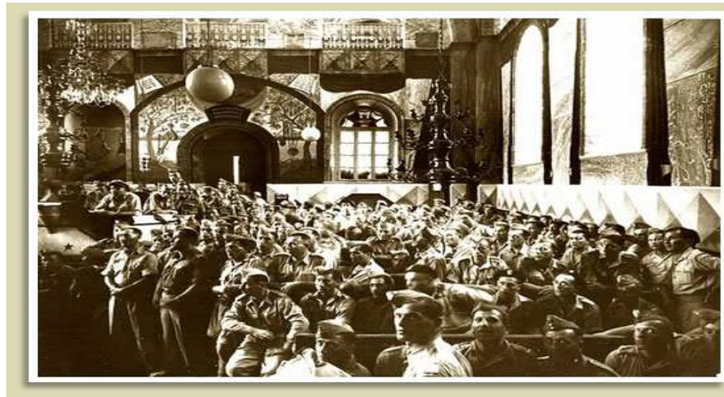
חיילים בבית הכנסת 'החורבה'