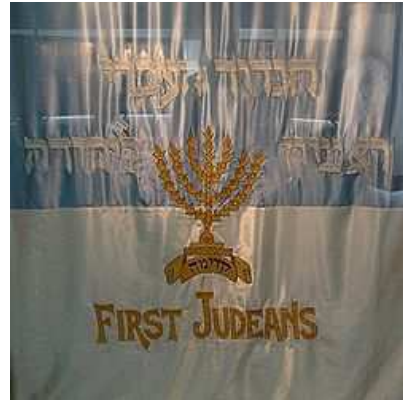
דגל הגדוד העברי