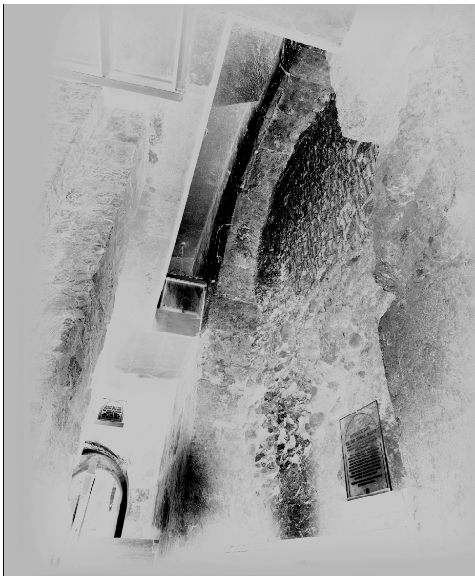
תמונה מס' 21: תצלום שער וורן כפי שהוא נראה כיום. (צילום: מקס ריצ'ארדסון).