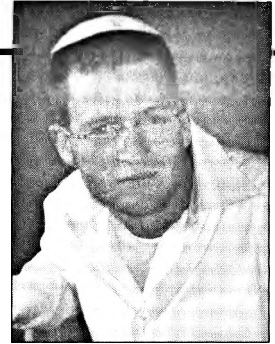
כ"ה אדר א' ה'תשמ"ו - י"ח אב ה'תשס"ו