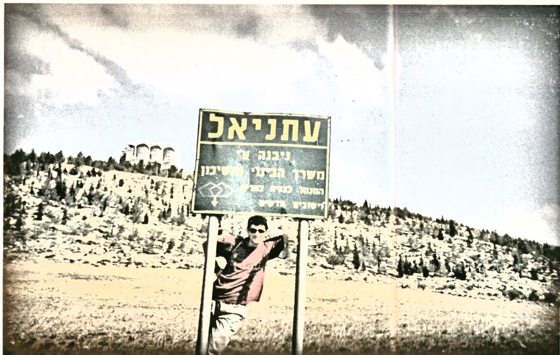
אבי בשיעור ד'