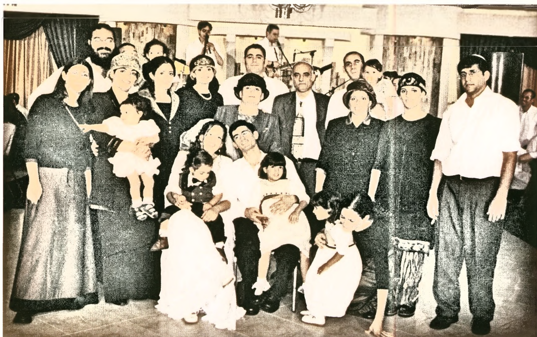
משפחת סבאג המורחבת