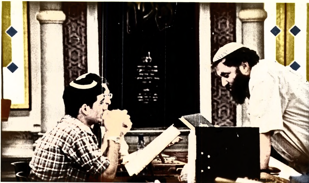
לימוד בחברותא עם דוד