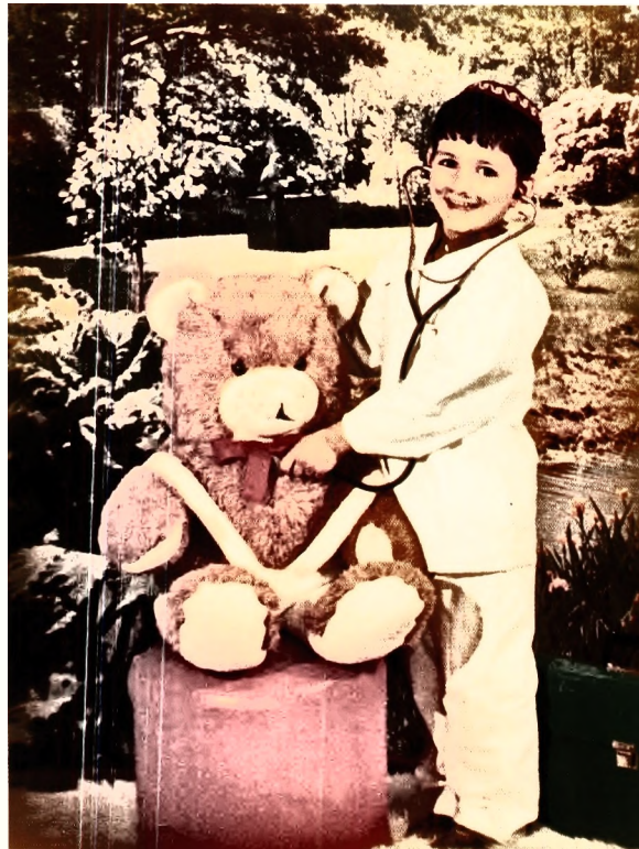
אבי מסיים לרופא