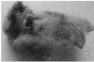
תמונה מס' 6