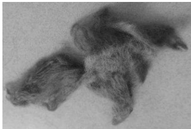
תמונה מס' 8