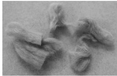
תמונה מס' 5