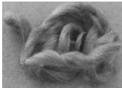
תמונה מס' 4