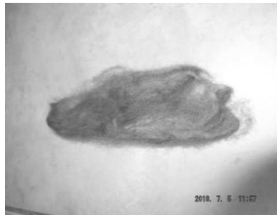
תמונה מס' 2

3. ביום, בישול בחום נמוך [כ-60 מעלות] כשעה בשמש, התוצאה גוון כחול. תמונות מס' 3-4. בבישול בהרתחה מלאה של כמה דקות, הצבע נהרס.