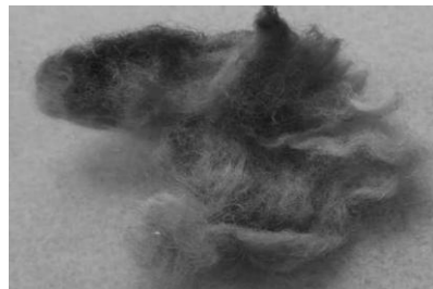
תמונה מס' 7