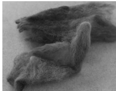
תמונה מס' 1