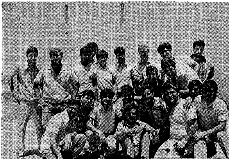
בימי העיון על רקע מערת המכפלה

נעם: אמר משהו מהמחזור בנחלים: "כשמדברים על מוטי, אפילו שיוד-עים שאינו בין החיים מוכרחים לחייך". הבדיחות הללו שהיה מספר בכל מצב — לא מתוך זלזול אלא מתוך תפישת השמחה כמות שהיא — מוכרחים לחייך.