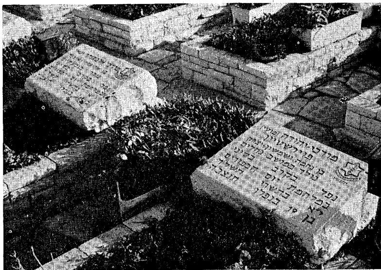
הנאהבים והנעימים בחייהם ובמותם לא נפרדו

יענך ה' ביום צרה. משל לאב ובן שהיו מהלכין בדרך ונתיגע הבן. אמר לאביו, והיכן היא המדינה? אמר לו, בני סימן זה יהא בידך, אם ראית בית הקברות לפניך, דע כי המדינה קרובה לך. כך אמר הקב"ה לישראל. אם ראיתם שהצרות מכסות אתכם, באותה שעה אתם נגאלים, שנאמר יענך ה' ביום צרה ישגבך שם אלהי יעקב. אלהי אברהם ואלהי יצחק איך כתיב כאן, אלא אלהי יעקב. ולמה, אמר ריש לקיש משל לאשה עוברה שהיא מקשה לילד, אמרין לה לית אנן יודעין מה נאמר לך, אלא מאן דעני לאמך בעידן קשיותה יענה יתיך בעידן קשיותך, כך כתיב ביעקב (בראשית לה) העונה אותי ביום צרתי אמר להם דוד מי שענה יעקב אביכם בעת צרתו, יענה אתכם בעת צרתכם, הוי יענך ה' ביום צרה ישגבך שם אלהי יעקב. (שוחר טוב תהילים כ)