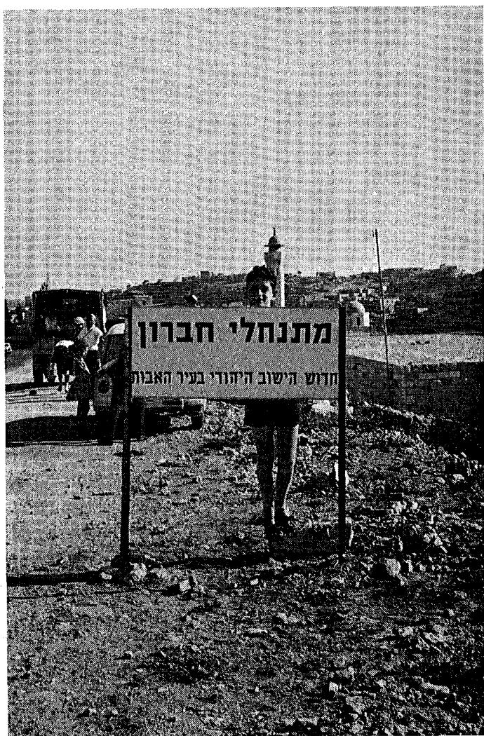
מוטי בחברון — תשכ"ח. הזיקה למקום כבר מכתה ז'.