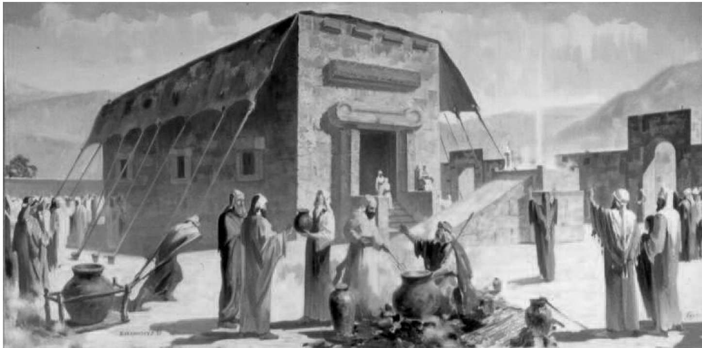
משכן שילה: בשילה בנו ישראל מזבח מאבנים, כנראה בציור.

דברים אלו מעוררים תמיהה, שכן כאמור לעיל מפשט הכתובים