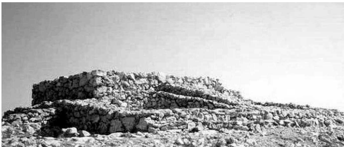
המזבח בהר עיבל: בתמונה נראה המזבח שהתגלה בהר עיבל.

נאמר בתורה (שמות כ, כ-כא): "מזבח אדמה תעשה לי... ואם מזבח אבנים תעשה לי, לא תבנה אתהן גזית". רבי ישמעאל 13 מפרש ש'ואם מזבח אבנים' אינו רשות אלא חובה, ואילו הציווי 'מזבח אדמה תעשה לי' בא לחייב לחבר את המזבח לאדמה, ולאסור