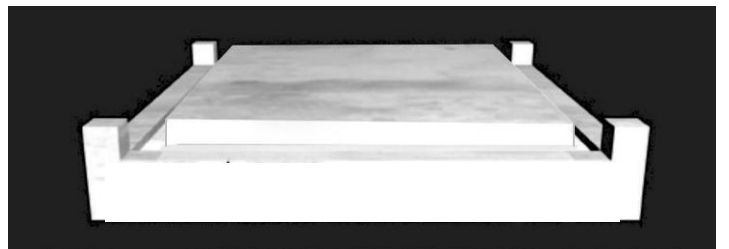
בתמונה נראית שיטת הריטב"א, כשמקום המערכה מוגבה מעל גג המזבח, ומקביל לגובה הקרנות.

הריטב"א (סוכה מה,א), לעומתם, מקבל את הנוסח הישן של הגמרא 'עלה שלוש וכנס אמה זה מקום קרנות', מאחר שזו הגרסה בעיקר הספרים. 1 לדעתו, מבנה המזבח הוא: המזבח עולה אמה ונכנס אמה - וזה היסוד. אחר כך המזבח עולה חמש ונכנס אמה - וזהו הסובב. אחר כך המזבח עולה שלוש ונכנס אמה, ואותה אמה היא מקום קרנות, ויש בה קרנות בארבע פינותיה. לאחר מכן המזבח נכנס עוד אמה, שהיא אמת מקום הילוך רגלי הכהנים, ורק אז מתחיל מקום המערכה שהוא גבוה אמה, כקרנות, כך שגובה מקום המערכה עצמו הוא עשר אמות, כגובה הקרנות.