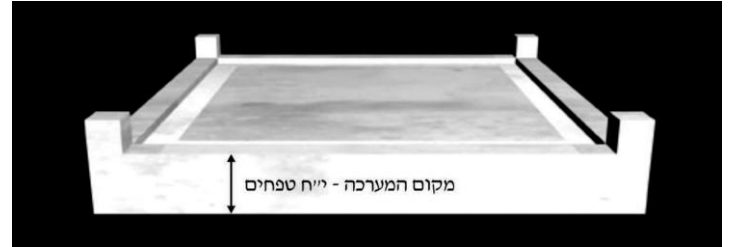
בתמונה נראית שיטת רש"י והרמב"ם, כשמקום המערכה נמצא באותו מפלס של גג המזבח, תשע אמות מעל רצפת העזרה, והקרנות בולטות אמה מעליו.

כשיטת רש"י פירשו ר"ח (שם), ר"ש (מידות ג,א) והרמב"ם (בית הבחירה ב,ז).