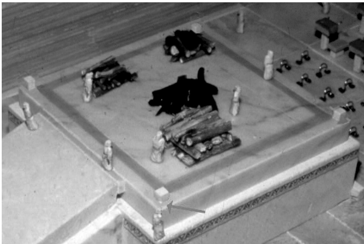
בתמונה נראית קרן המזבח כשהיא לא נמצאת בפינה, אלא מעט יותר פנימה, כשיטת הראב"ד

בתיאור המזבח שבנה שלמה נאמר שגובהו עשר אמות. המזבח