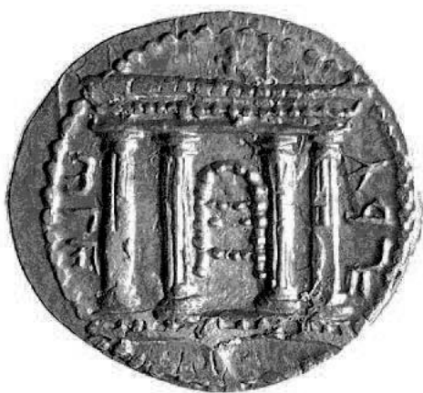
מטבע מתקופת מרד בר כוכבא, כשבמטבע מוטבע תבנית של ההיכל

אמנם, כמסופר במדרש, ניסיון זה לא צלח, אך הוא זה שהוליד לאחר זמן לא רב ניסיון נוסף לבניין המקדש, בדמות מרד בר כוכבא. מרד בר כוכבא היה, כידוע, ניסיון לשחרור דתי ולאומי כאחד, כשבניין המקדש וחידוש העבודה בו הן מהמטרות המרכזיות של המרד. המרד התחיל שישים ושתיים שנה לאחר חורבן הבית ונמשך ארבע שנים. נהרגו בו מאות אלפי יהודים - דבר המעיד על הנחישות העצומה שהפגינו בר כוכבא ולוחמיו, שלא ויתרו ולא נסוגו אחור, אלא נלחמו עד טיפת דמם האחרונה. השאיפה העצומה שקיננה בלב בר כוכבא ובלב לוחמיו לבניין המקדש מחדש באה לידי ביטוי במטבעות הרבים שהנפיק בר כוכבא במשך שנות המרד, ובהם מוטבעים ההיכל ורבים מכלי המקדש. בהקשר לזה ראוי לציין דעה המובאת אצל חלק מהאחרונים 1 , שבספרי היסטוריה שנכתבו על ידי גויים כתוב, שבר כוכבא אף הצליח לחדש את העבודה במקדש עד שאדריונוס הפסיק זאת. בשו"ת 'שאלת יעב"ץ' (ח"א סימן פ"ט) כתב, שהיו מגדולי ישראל שקיבלו רשות להקריב קרבנות במקום המקדש לאחר חורבן בית שני (ראה שם הוכחותיו לכך).