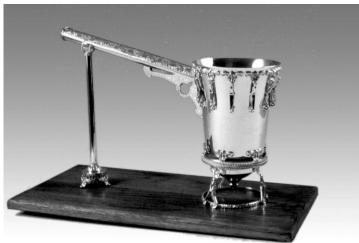
מזרק מזהב, כפי שנעשה ב'מכון המקדש'.

ד. כלי קיבול המשמש לקבלת דם הקרבנות וזריקתם על המזבח. ה. למזרק אין תחתית ישרה, אלא תחתית מחודדת או עגולה, כדי שלא יניחו אותו ואז ייקרש הדם ויפסל לזריקה. 6 ו. בפסוק, כאמור לעיל, נאמר שיש לעשות את המזרק מנחושת. אך למעשה, מן הראוי לעשותו מזהב או כסף כפי שנעשה במשכן, בבית ראשון ובבית שני. 7