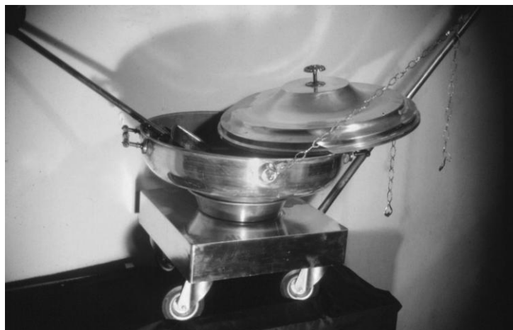
פסכתר מנחושת, כפי שנעשה ב'מכון המקדש'.

א. כלי בצורת סיר בעל נפח קיבול של לתך (חצי כור) - 15 סאים - 124.4 ליטר. 2 הפסכתר שימש לאיסוף הדשן שהצטבר לערימה (ה'תפוח') על גג המזבח והוצאתו אל מחוץ לירושלים. 3 ב. לפסכתר שתי שרשראות בשני קצותיו, באמצעותם היו הכהונים מורידים את הפסכתר מהמזבח לאחר שמלאוהו בדשן שעל המזבח. 4