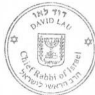
דוד לאו הרב הראשי לישראל