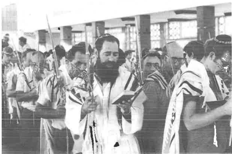
שליח ציבור בבית הכנסת בסעד, הושענא רבה

בספר של אחד הפילוסופים הגרמנים (שופנהאואר?) למדתי, כי לא ניתנה לאיש היכולת להכיר את זולתו, על כל מכלול תכונותיו, סגולותיו ומידותיו. קביעה זו מנומקת שם בתיאוריה שנוגה, כי הכרת אדם כלשהו מותנית בידיעה המשולבת משלושה מרכיבים: כיצד רואה האדם את עצמו; כיצד רואה אותו הזולת; מי ומה הוא לאמיתו של דבר. לפי תיאוריה זו, מכיון שבידינו כמעט רק עדויותיהם של אחרים, נמצאת היכרותנו את ידידיה חסרה ומקוטעת. ואף על פי כן – וללא יומרות להכיר את האיש הכרה מלאה ומספקת – דומה כי אפשר להוסיף עוד קווים לדמותו. אלא שלא כל הקווים מצטרפים לתמונה אחידה. יש בהם המקבילים אלה לאלה ויש החותכים אלה את אלה. הדבר אינו צריך להפתיע. הן כך הדבר אצל כולנו. בכולנו קיימים ניגודים ובכולנו יש