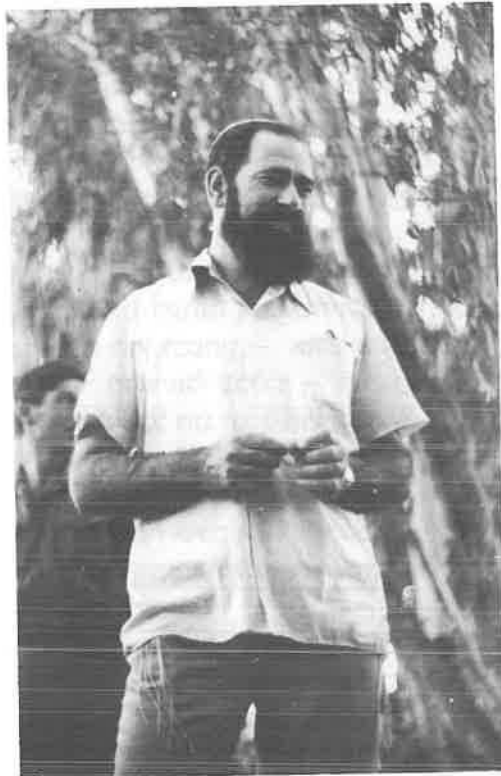
המזכיר הכללי של 'בני עקיבא' מבקר במחנה קיץ בצפון הארץ

הוא היה אידיאליסט. האמין שהטוב סופו לנצח. בטוח היה שיש בכוח אנוש לשנות את העולם. את עולמנו שלנו – מי יכחיש זאת – אכן שינה. עם כל הרצינות שאיפיינה את האיש – נשאר צעיר, ושנות הסער והפרץ נמשכו בו עד קץ ימיו. לא ניתן לשים עליו רסן. מימי בית הספר פועל היה לפי סדר העדיפויות הנכון בעיניו. בעיניו ולא בעיני איש זולתו. אל הישיבה הגבוהה יצא לפני סיום התיכון ובניגוד לדעת אביו.