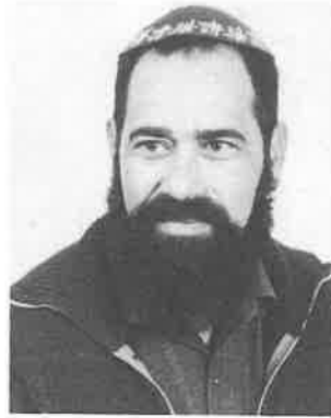
אין עושיין נפשות לצדיקים; דבריהם הן הן זכרון. ירושלמי שקלים, פרב היה