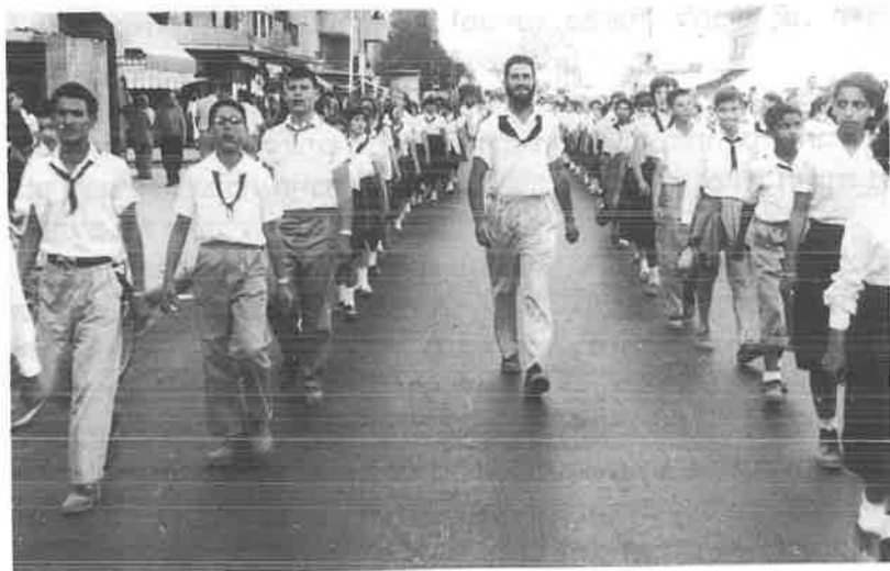
צוער עם חניכים ביבני עקיבא' ברחובות תל-אביב