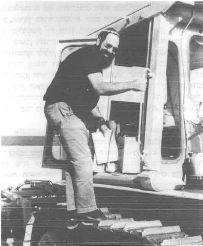
בדרך לעבודה בסער