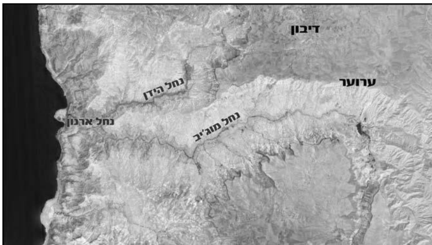
איור 3.21: את הנחלים ארנון. (עיבוד: תמי יהושע)

נשאלת השאלה למה מופיע נחל ארנון ברבים "נחלים ארנון"? עיון באגן הניקוז של נחל ארנון מגלה, כי באגן שני יובלים עיקריים נחל הידן הצפוני יותר ונחל מוג'יב הדרומי, וביניהם אזור רמתי עליו נמצא את ערוער ודיבון (איור 3.21).