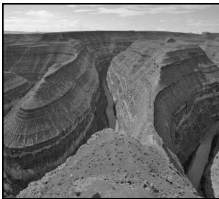
איור 3.20: נפתולים (מיאנדריים) חתורים. ( ;)