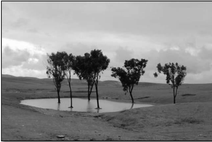
איור 3.18: סכר "לימן" בנגב בצפוני מלא מים. (צדוק, 2008)

בימינו אפשר לראות את הגבים המתוארים במקרא בסכרי הלימן הפזורים בנגב (איור 3.18).