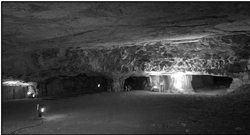
איור 36: בתוך מערת צדקיהו

מערת צדקיהו מוזכרת במסכת עירובין (סא ע"ב) בנושא תחום שבת: "אפילו היא פּעֻצֵרֶת צִדְקָיָהוּ: מְלֵךְ וְהַיְדֵדָה - מְהַלֵּךְ אֶת פִּילָה וְחֹצֵה לָהּ אֶלְפִים אַמָּה". נבין מגמרא זו כי המערה נחצבה כבר בימי בית ראשון. לוי (2006) טוען שהמערה היא מימי בית שני. לוי (2016) מתאר את החתך הגאולוגי: