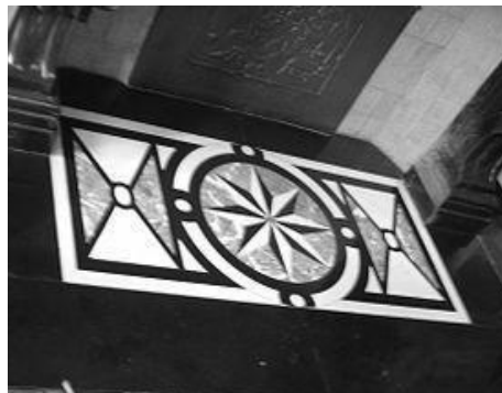
באסקופת בית המשלבת גיר שחור ושיש לבן (Bandinelli, 2007)