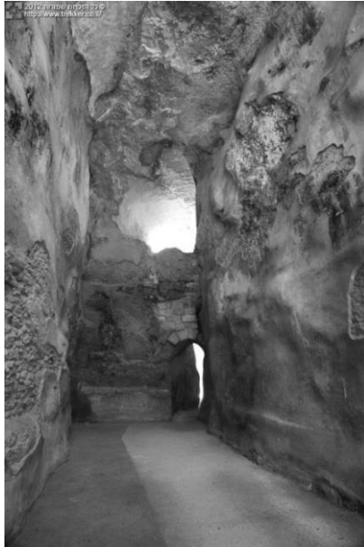
איור 63: מאגר המים בציפורי. הקירות טווחו למניעת חלחול (שץ, 2012)