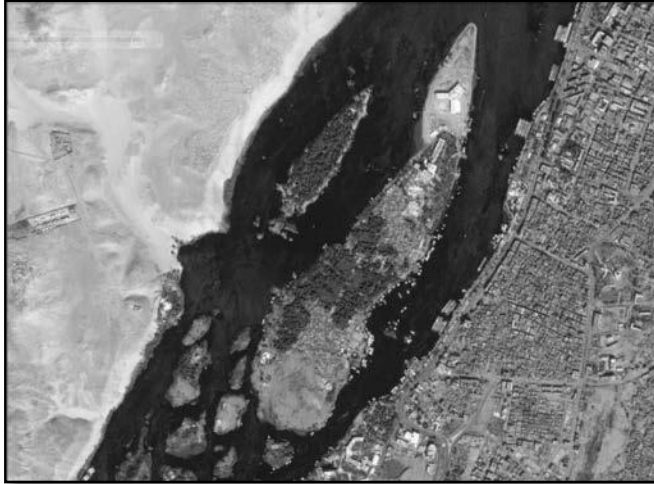
איור 4.24: האי אלפינטינה שבנילוס.

מקדש יהודי נוסף שהיה קיים בעולם העתיק הוא המקדש ביב. המקדש היה על האי אלפינטינה (איור 4.24) אשר נמצא כיום בעיר אסואן שבמצרים הדרומית. על נוכחות היהודים ביב ידוע בעיקר מפפירוסים בארמית שנשתמרו. זמן הקהילה הוא בערך המאה ה-6 לפני הספירה. על גבי האי היו מקדשים נוספים אך דווקא בחלקו הצפוני הבנוי מסחף שהצטבר נמצא המקדש היהודי. מקדש יהודי זה חרב בשנת 410 לפני הספירה.