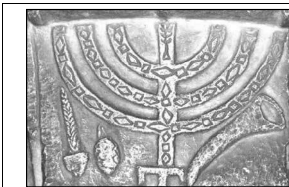
איור 4.22: תבליט המנורה שנמצאה בבית הכנסת באוסטיה. בצד אחד של המנורה שופר ובצדה השני לולב ואתרוג. צורת הבסיס של המנורה שונה מצורת הבסיס מתבליט המנורה שבשער טיטוס ברומא. (המוזיאון היהודי של רומא, ה"ת)