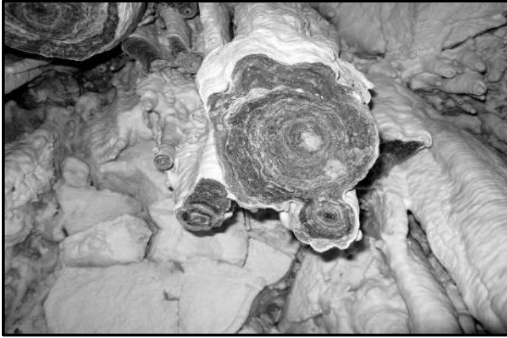
איור 53: כלי בהט, אפשר לראות את המבנה השכבתי של גוש האבן (Юкатан, 2011)

הבהט נמצא כחומר ששימש לבנייה מפוארת באתרים ארכאולוגים בישראל. פרומקין ועמיתיו (2014) מדווחים על מקור מקומי שהיה יכול לתרום את הבהט בישראל. בסקר נרחב של מערת עבוד הנמצאת במערב הר אפרים, הם גילו סימני חציבה של בהט במערה. מערת עבוד נמצאת בתוך