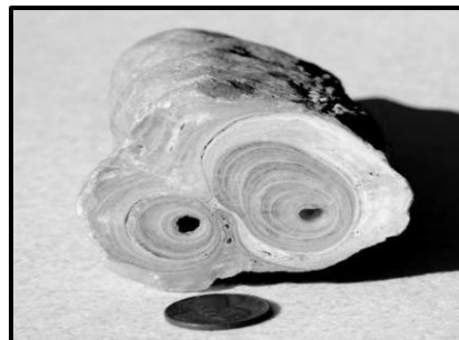
חתך רוחב של נטיפ (Lynch, 2012)

איור 52: חתך רוחב של נטיפ והתגבשות הבהט על קירות מערה