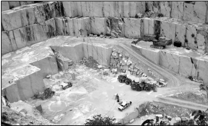
איור 14: מחצבת השיש הלבן בקררה, איטליה (Delicious Italy, 2010)

באגדה שפתחנו בה אפשר להסביר כי השיש הטהור הדומה למים שרבי עקיבא מתאר, הוא השיש הלבן והצח שהבוהק שלו דומה לבוהק של מים (איור 14). הסבר אחר יכול להיות כי דווקא השיש שראה רבי עקיבא בחיזיון דומה לשיש שהיה בבית המקדש של הורדוס שדומה לגלי הים, ואם כך החיזיון של הכניסה לפרדס יכול להיות קשור לחיזיון המתאר את בניית בית המקדש.