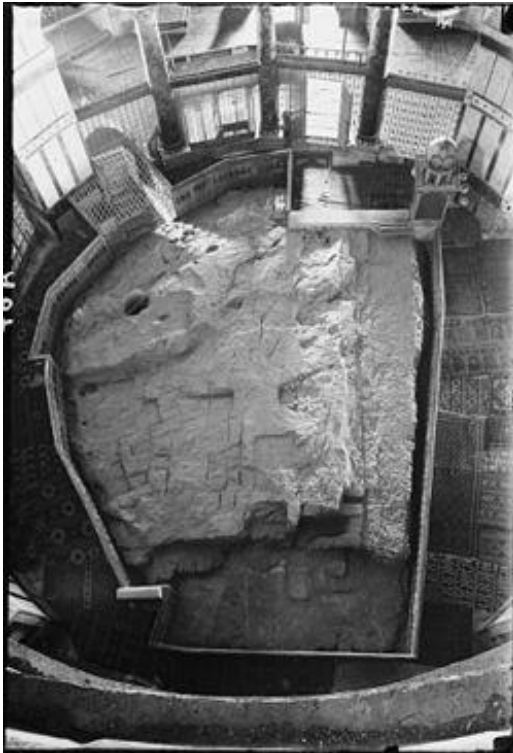
איור 59: אבן השתייה, מבט מלמעלה

אבן השתייה הממוקמת בהר הבית מוזכרת במשנה. לדברי חז”ל האבן נקראת כך מלשון תשתית: