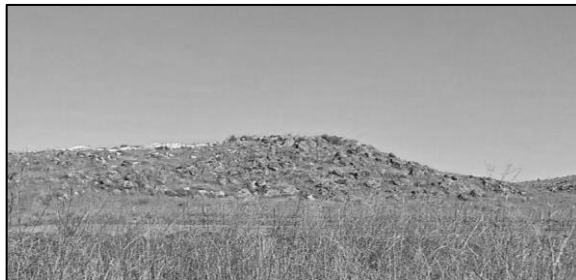
איור 17: גבעת "חמשת המלכים" המכוסה בגושי צור (Ranbar, 2013)

ולכן יש מקום לפרש כי אבני האלגביש הן מטאוריטים שנפלו בתזמון ניסי – בזמן מלחמת יהושע ובזמן מכת הברד במכות מצרים.