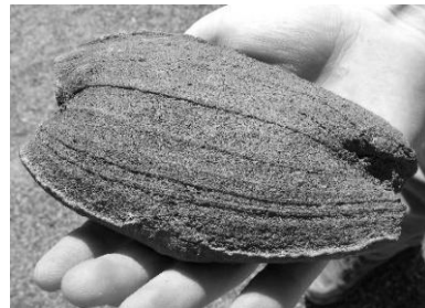
צילום: Wilson, 2010