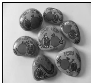
שימוש בחלוקי נחל האומנית שולה יוסלביץ, אמירים

איור 18: חלוקים, אבנים מפולמות בלשון המשנה, כחומר גלם לכתובה וציור