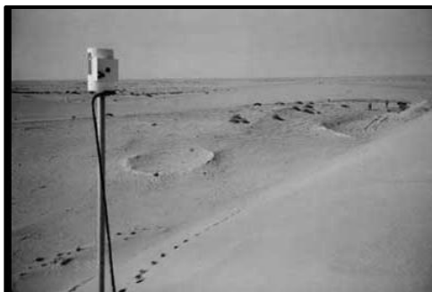
איור 64: מכתש פגיעה מטאוריט בערב הסעודית. קוטר המכתש 11 מטר (Shoemaker & Wynn, 1997)

נשרא שבערביא – פ' גאון יש בערביא בית ובית ע"ז היא ואית בה אבן וחוקק עלה וסגדון לה.