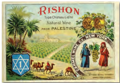
יין כרמל - ניו יורק 1904

ג. החלה להוריד יותר ויותר את התשלום על הענבים, ובמקביל להעביר משפחות של כורמים לעסוק בענפים חקלאיים אחרים או ליישבם במקומות אחרים.