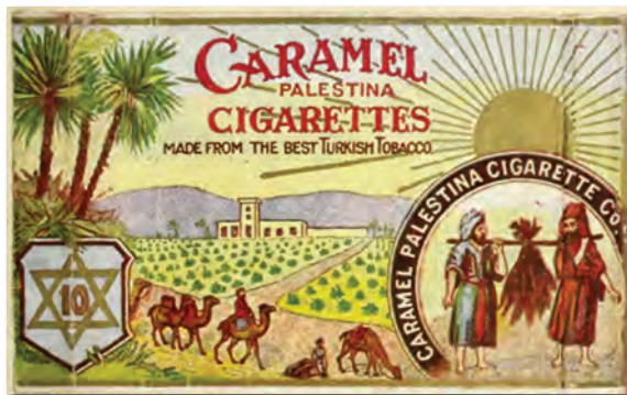
סיגריות מטבק מהמושבות - 'כרמל' - ניו יורק 1904