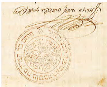
חתימות הרב אהרן אורלנסקי והרב טודרוס כהן