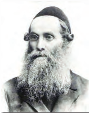
הרב אליהו דוד רבינוביץ-תאומים האדר"ת

ככ"ט בטבת תרנ"ח (22.1.1898) נפטר בירושלים הרב יהושע ליב דיסקין. פטירתו הייתה משמעותית במיוחד לכוללים ולמוסדות תחת הנהגתו, שהיוו במידה רבה אופוזיציה לוועד הכללי, 63 אולם הייתה לה משמעות רבה גם עבור הרב נפתלי הרץ הלוי, שהיה ממקורביו של הרב דיסקין ומינויו ביפו נהנה מתמיכתם של הרב סלנט ושל הרב דיסקין גם יחד. בנוגע לסוגיית השמיטה הייתה לפטירת מהרי"ל דיסקין משמעות מיוחדת, משום שמתווה ההיתר שגיבש הרב הלוי בשמיטה הקודמת, נעשה בעיקר בגיבוי של הרב דיסקין.