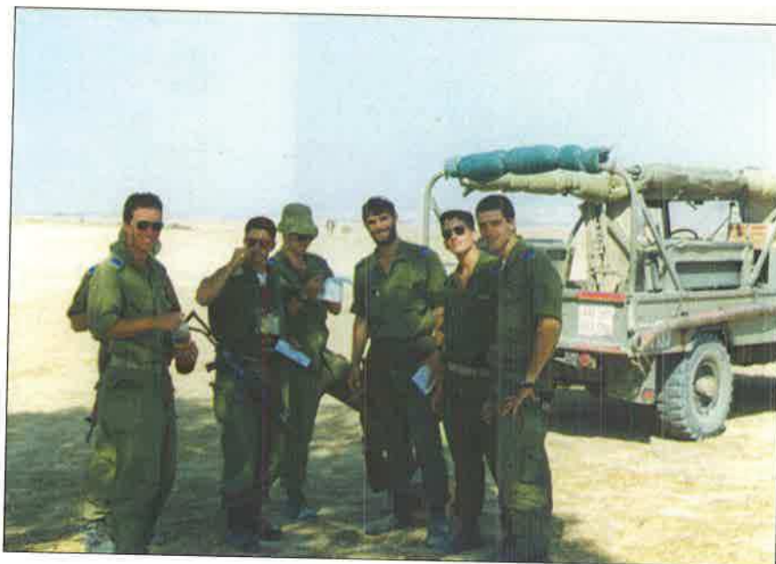
ניוטים בקורס קציני שריון