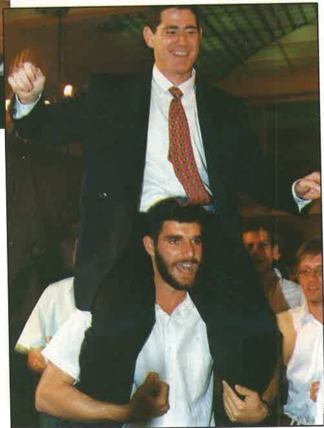
החתן על הכתפיים בחתונת אדרה וקרי