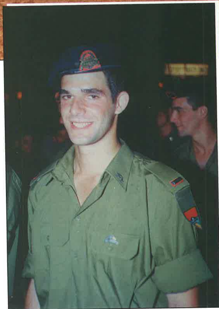
סיום קורס קצינים