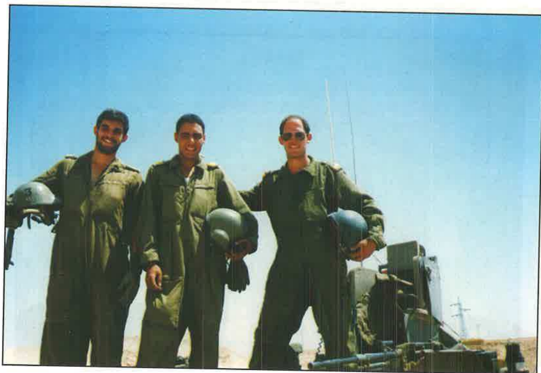
בקורס מפקדי טנקים - "מומלץ לקצונה בזימון ישיר"