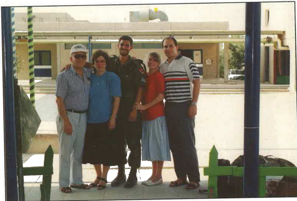
עם המשפחה בסיום קורס מט"קים