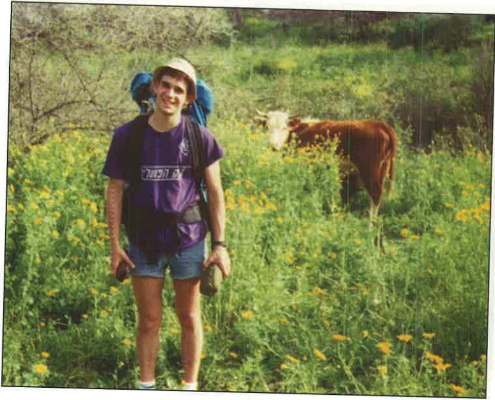
טיול לנחל עמוד - פסח תשנ"א