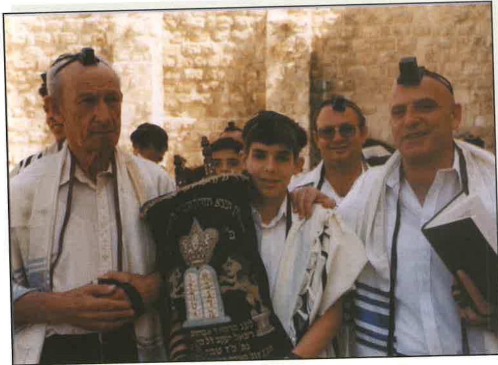
בר מצווה בכותל עם סבא דב ז"ל ואבא