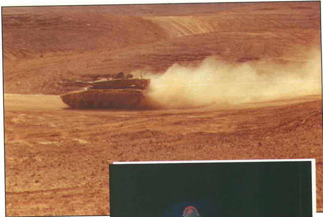
סיירים אלול תשנ"א (ספטמבר '91)