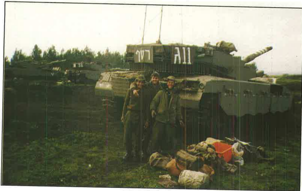
עם ארי ואייל צוות סמג"ד צמ"פ חורף תשנ"ב (92')