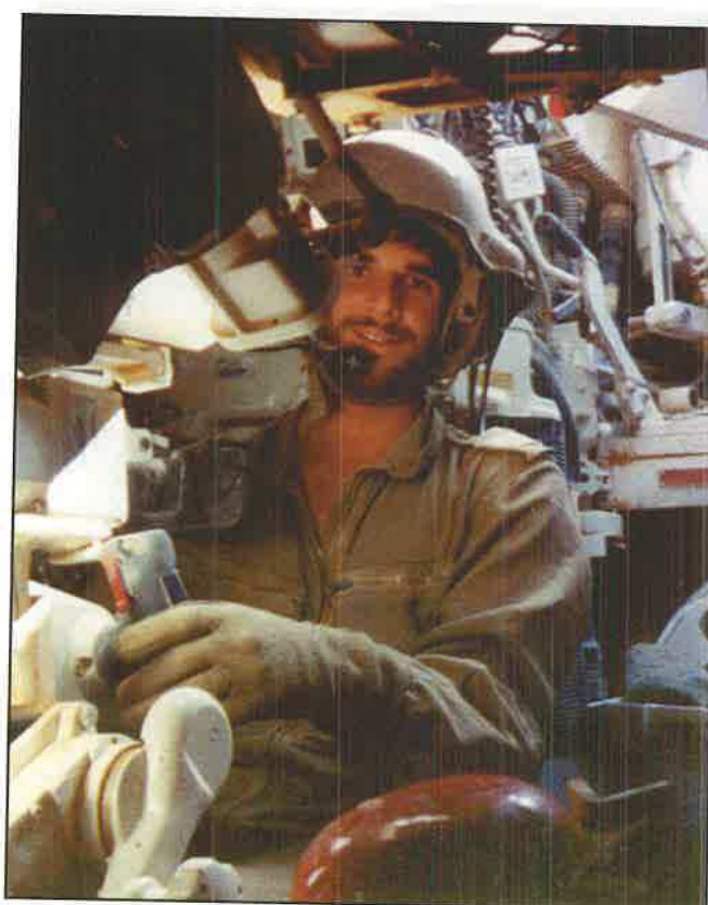
בתא התותחן במהלך הקק"ש