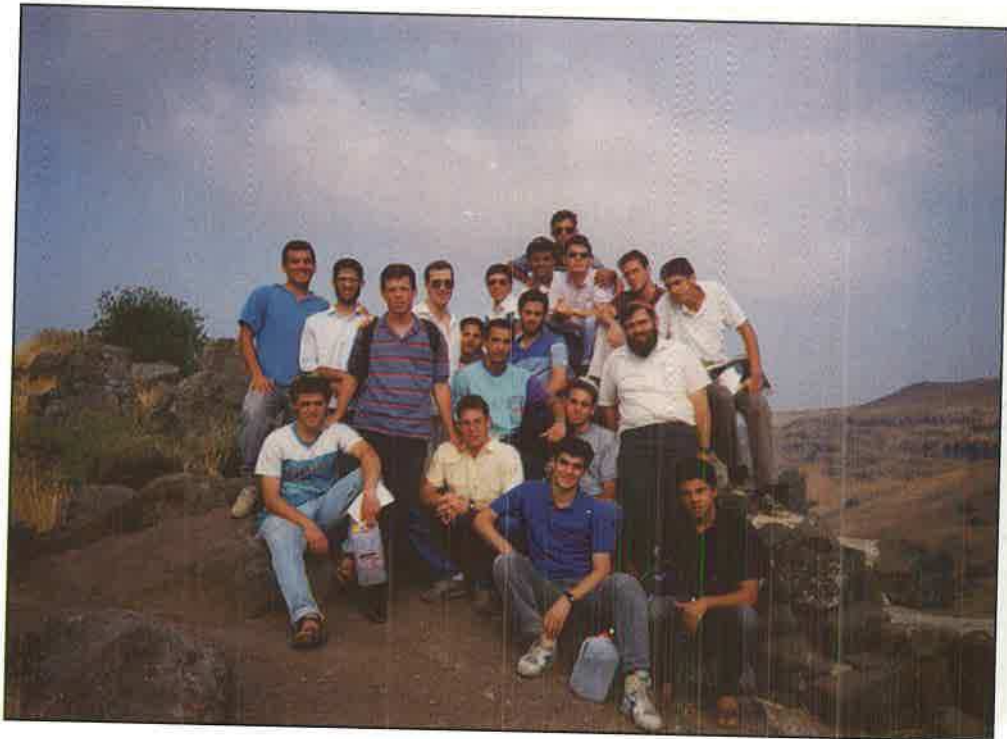
טיול גמלא - סוף שיעור א'