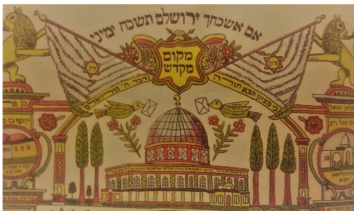
'מזרח' משנת תרפ"ו, שנשלח מירושלים לגולה ומעל הכיפה נרשם 'מקום מקדש'

ניתן להוסיף ולהרחיב בדוגמאות אודות ציורי המקדש וקודש הקודשים, אשר נפוצו בירושלים ובארצות הגולה. להלן יובאו כמה מהן לדוגמה (מתוך כתב עת 'אריאל', חוברת מס' 180 מתוך מאמר מאת שלום צבר).