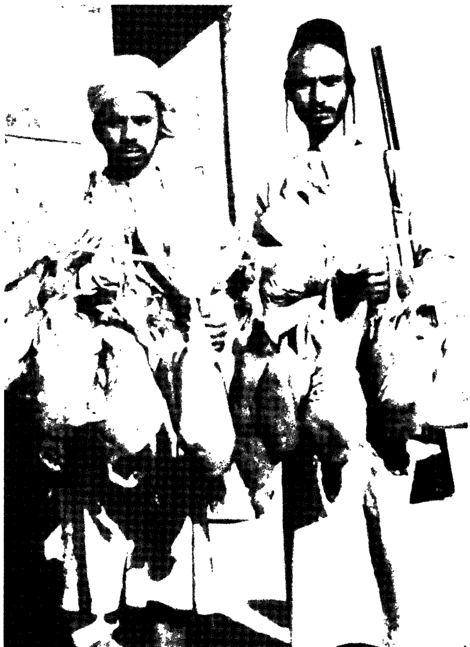
כמה פרטים מן העוף הקרוי כפי תושבי תימן 'עקאב' (קורא) שניצודו בתימן בעבור המשלחת הרפואית האיטלקית. (מצילומי יחיאל חייבי). לגבי הקורא הייתה מסורת שהתירה את אכילתו ואכן יהודי תימן נהגו לאכלו