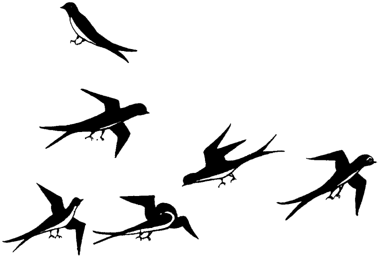
עופות הקרויים בערבית 'ח'טאטיף' (היחיד: 'ח'טאף') – מתוך חיבור ערבי משנת 1462

אגב, אהרוני מביא הוכחה מהמקרא ש"הציפור" או ה"דרור" הוא דרור הבית 31 ואינו זהה לסנונית. את הפסוק 'כצפור לנוד, כדרור לעוף – כן קללת חנם לא תבוא' (משלי כו ב) הוא מפרש: כשם שציפור אינה נדה ודרור אינו עף – כך קללת חנם לא תבוא. אהרוני מצייץ שהדרור היא ציפור יציבה שאינה נודדת ממקום למקום אפילו בארץ. לעומת זאת, הסנונית נודדת ומזוהה על פי תרגום 'יונתן' עם ה"עגור" (ירמיהו ה, ז). 32 כמו-כן התכונה