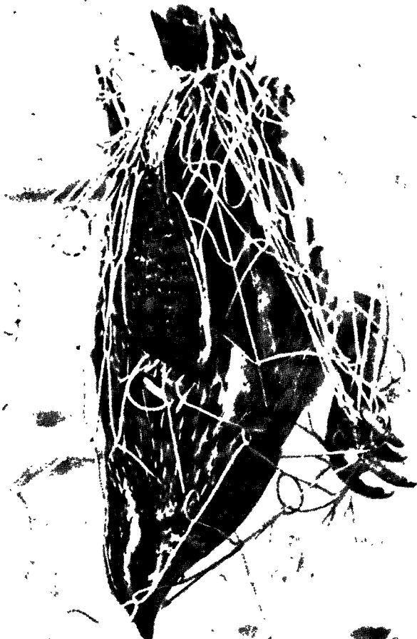
שלו שנצוד ברשת

150,000 שלווים, בשנת 1900 ירד מספרם ל-56,000 ובשנת 1904 הגיע מספר הניצודים ל-30,000 שלווים.