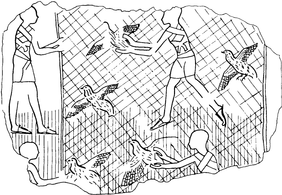
ציד שלווים ברשתות מתמשייה קיר בנוא אמון שבמצרים העתיקה

ערבים מימי הביניים מספרים שבימיהם תושבי אזור צפון סיני צדים שלווים שמגיעים כל שנה מכיון הים התיכון. 7 תושבי המקום היו צדים את השלווים בדרכים שונות, אך שיטת הציד באמצעות רשתות הוכחה כיעילה ביותר. בתקופת נדידת הסתיו פורשים התושבים רשתות לאורך כל קו החוף. כאשר השלו מגיע מן הים במעוף הנמוך ובמהירות 35-50 קמ"ש הוא אינו מספיק להבחין במלכודת ונתקל ברשת הצפופה ומסתבך בה. הציד הנמרץ באמצעות רשת כפולה שפותחה כנראה במחצית השנייה של המאה התשע-עשרה, הביא להפחתה ניכרת במספר השלווים הנוודים. תהליך זה החל כאשר החל משנות השבעים של המאה התשע-עשרה החלו לייצא כמויות עצומות של שלווים לארצות אירופה באמצעות ספינות קיטור; הצרכניות העיקריות היו יוון, איטליה ואנגליה. הנתונים שנביא להלן מתייחסים לכמויות הייצוא ממצרים, ועל-פי ההערכה כמות דומה נצודה בחופי רצועת עזה וסיני.