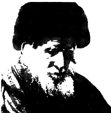
הרב שמואל סלנט (1818-1909)