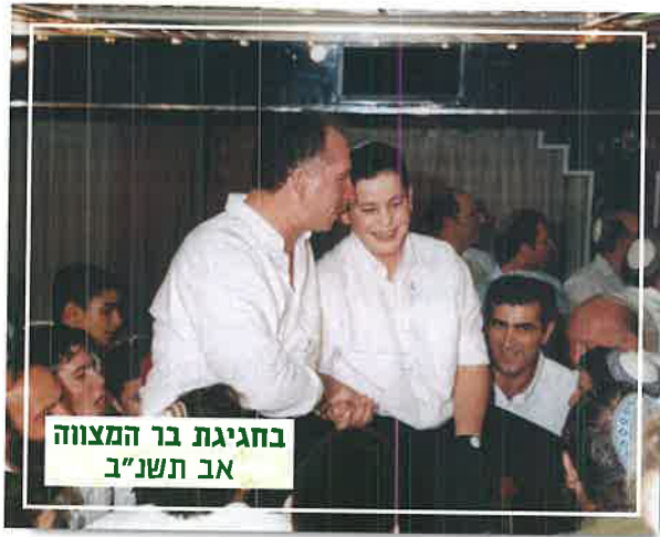
בחגיגת בר המצווה אב תשנ"ב