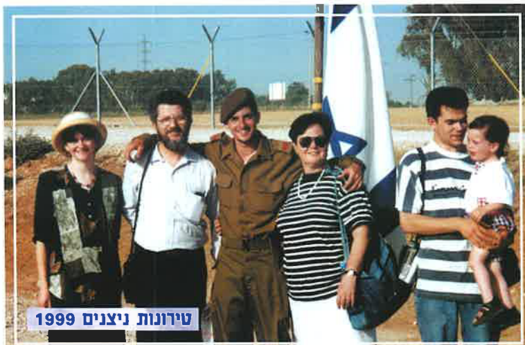
טידנות ניצנים 1999