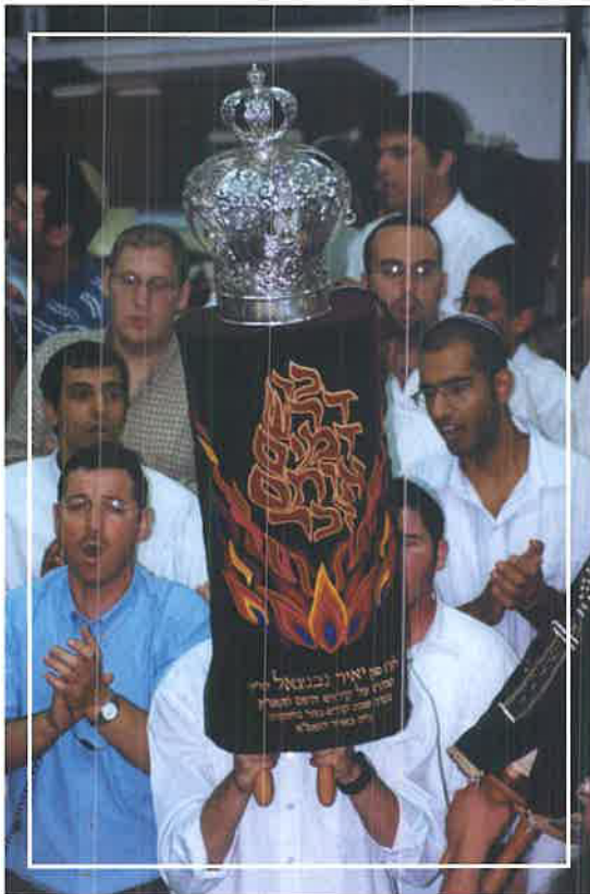
הכנסת ספר תורה לעין יאיר בישיבת הגולן