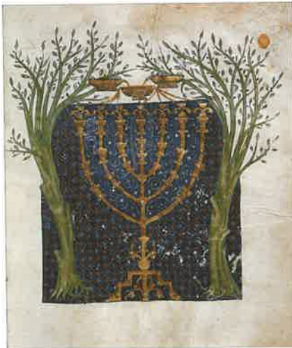
תמונת חזון זכריה תנ"ך סרווירה, שנת 1300, הספרייה הלאומית ליסבון