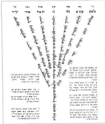
הצגת מזמור ס"ז כמנורה, סידור תפילת כל פה