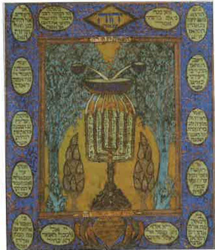
תמונת חזון זכריה לוח שוית, תורכיה, המאה היט'-כ', דוד אלגראנאטי