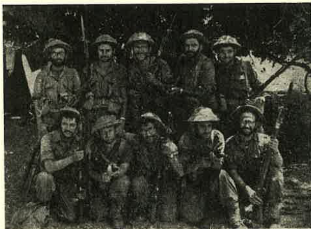
בשורות צה"ל עם חבריו לישיבה (יושב קיצוני משמאל)