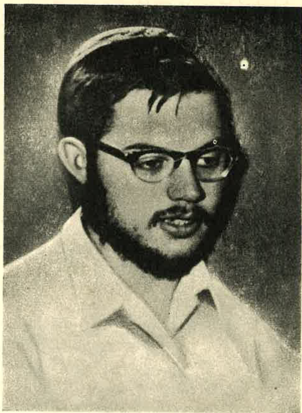
נולד ער"ה ת"ש - גלב"ע כ"ג מנ"א תשי"ט

וְלִקְבוֹת אַמּוּלוֹת רוּחַ חַיִּים, וְלִפְרָחִים קַמּוּלִים טַל שָׁמַיִם, וְלִנְפֻשׁוֹת נוֹאֲשִׁים חֶלֶד מִצְהָרִים עַתָּה יְקוּם מִיְהוּדָה וִירוּשָׁלַיִם לְשִׂמְחַח לְבַב וְנִצְרֵי וְשָׁבִי, וְאֵלֵהי אָבִי לִי יָבִיא אֶת-אֱלֹהֵי הַנְּבִיא.