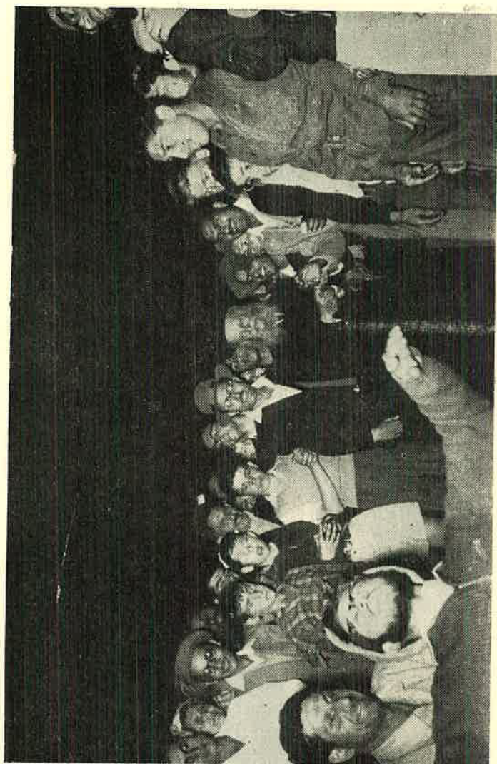
בשעת ריקוד באמצעותו של מעגל בליל חג העצמאות