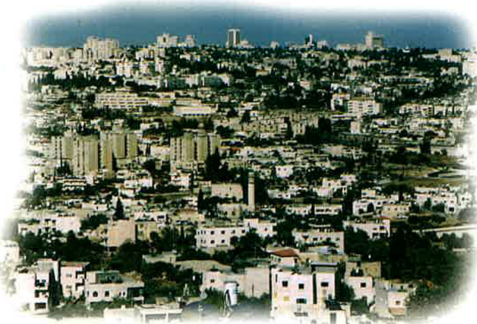
נוף ירושלים הניבט מהר גילה View of Jerusalem from Har Gilo

ישנה כאן גם מכללה שהקימה "האגודה למען החייל", שאליה מגיעים חיילים ישראלים מכל הארץ, כדי ללמוד נושאים הלקוחים מההסטוריה והגיאוגרפיה של האזור,