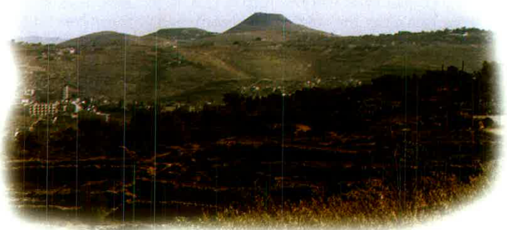
מראה ההרודיון מכיוון ירושלים View of Herodian from the Jerusalem-Hebron Road

האחת היא "פנים להר" - הצד שפונה אל ההר, שהוא אזור פורה ועשיר בגידולים. צד זה מאפשר לאיכרים המעבדים את הטרסות הללו שבהרים להתפרנס בהצלחה מהחקלאות. השניה היא "פנים למדבר" - הכיוון השני שפונה אל המדבר, כאשר שורש המילה "מדבר" בעברית הוא "דבר". זה מזכיר לנו את החמישית מבין עשר המכות שלקו בהן המצרים שהכתה את בעלי החיים. זה מזכיר לנו גם שהביטוי העברי לרעיית כבשים הוא: "הדברת הצאן", "להדביר את הצאן".