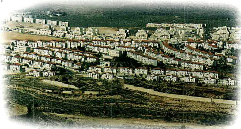
העיר ביתר - תגס"ד - מראה מהיישוב נווה דניאל בגוש עציון The City of Betar - Viewed from the Settlement of Neve Daniel in Gush Etzion

ולבסוף, אנחנו מסתכלים הלאה, רחוק יותר שמאלה מצפון לנו, ומזהים את מגדל המים של יישוב יהודי אחר שקם כאן לאחרונה, אשר נקרא "נווה דניאל" על שם הנביא דניאל. היישוב החדש הזה ממוקם בנקודה שהיתה טבועה עמוק בתודעה היהודית