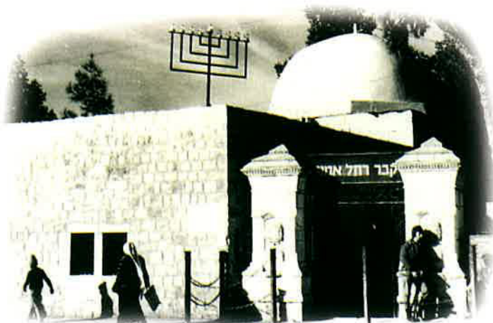
קבר רחל אמנו בבית לחם בשנות ה-1900 Rachel's Tomb (Kever Rachel) c. 1975

במילים אחרות, האזור שעליו אנחנו מביטים עכשיו הוא מקום הולדתו של דוד "מלך ישראל חי וקיים", דוד "נעים זמירות ישראל". האיש, שדרכו לשבח ולהלל את הקב"ה, כפי שהיא מתבטאת בתהלים ומשמשת כמקור כוח והשראה ליהודים בכל העולם ובכל הדורות. אנו מביטים, למעשה, אל האזור שהוא הנקודה ממנה מתחילה כל ההתפתחות של בית המלוכה הנצחי של עם ישראל - מלכות בית דוד, שכולנו מקווים ומתפללים שתשוב ותכונן במהרה בימינו, אמן.