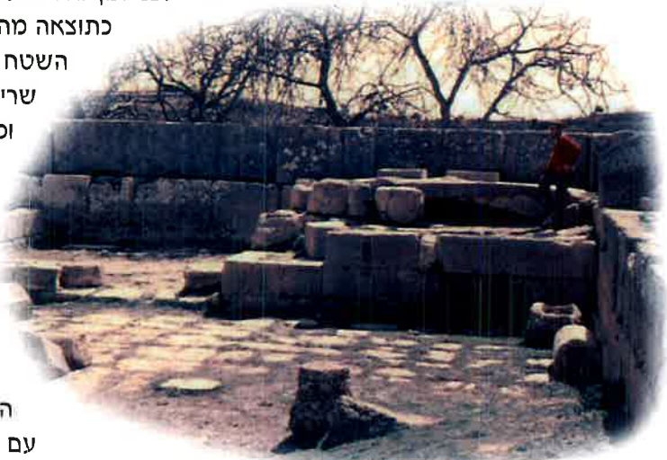
בור האים ב"אלוני ממרא" (תמונה ארכיונית) Cistern of 'Elonei Mamre (picture from archives of Chaim Mageni)

לפני זמן לא רב נערכו כאן חפירות ארכיאולוגיות. כתוצאה מהן ניתן למצוא, ממש על פני השטח וללא צורך בחפירה כשלהי, שרידים של כלי חרס, מכשירים וכלי בית, ששימשו את האנשים שהיו כאן לפני אלפי שנים, פשוטו כמשמעו, וללא שום הגזמה. פיסות החרס הללו הן רק רמז למספרן הרב של השכבות שנתגלו כאן, שהן שרידים של היישוב המפותח שהתקיים כאן בתקופות השונות.