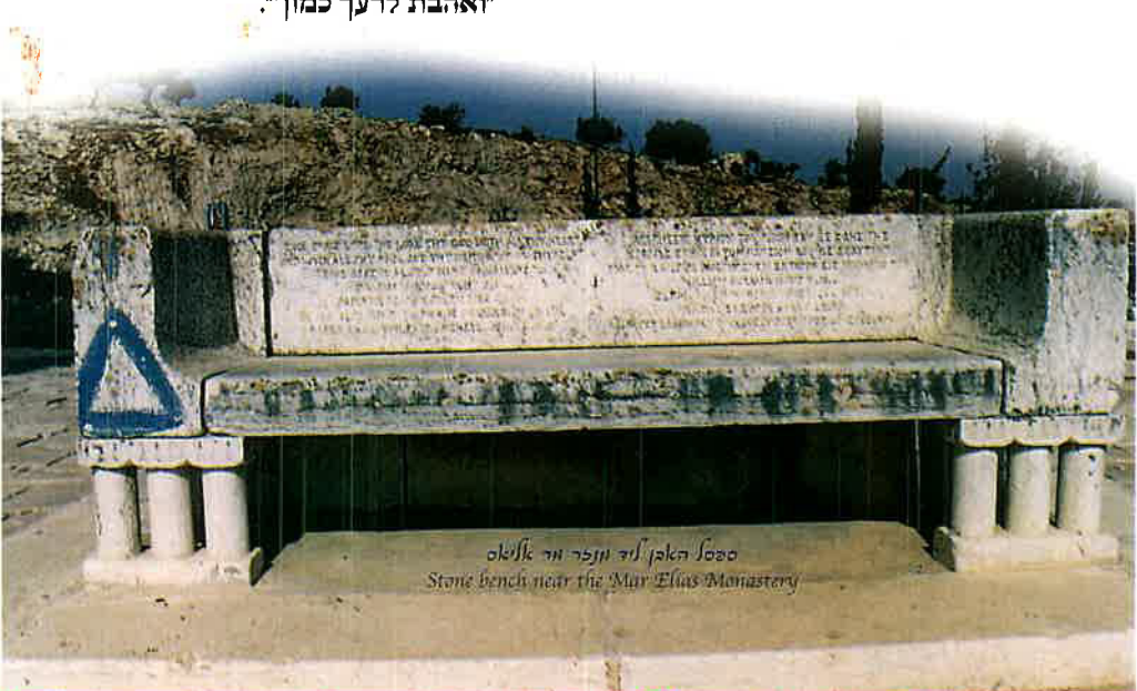
ספסל האבן ליד מנזר מר אליאס Stone bench near the Mar Elias Monastery

בדיוק ליד המנזר האורתודוכסי היווני ב"מר אליאס" אנו רואים לצד הכביש ספסל אבן מעניין ביותר. כאשר אנחנו מתקרבים אל הספסל אנחנו מבחינים בכתובת שחרוטה בסלע ביוונית ובאנגלית ובה כתוב: "ואהבת את ד' אלוהיך בכל לבבך ובכל נפשך". "ואהבת לרעך כמוך".