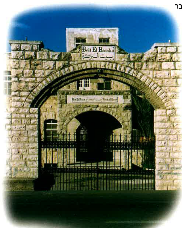
הַעֵם "עֵמֶק הַבְּרָכָה" הַתֵּן כִּי אֶתְתָּאֵר בְּשֵׁם הַבַּיִת הַזֶּה עַל שְׁמֵן הַבְּרָכָה The Biblical name "Emek HaBracha" is preserved in this Arab house in Gush Etzion

ממשימתם, ומה שהם תיארו היה פשוט דבר מופלא. מה שקרה, כנראה, היה שהגנרלים שבראש כל אחד מהצבאות - האדומי, המואבי והעמוני - הסכימו ביניהם להציב מארב שבו יתפסו את חיילי יהודה. אולם, לאחר שהסכימו ביניהם על כך, הם פשוט לא סמכו אחד על השני. ואותם הגויים, שאין להם אמון זה בזה בכלל, הציבו מארבים נפרדים. כל אחד מהצבאות הציב מארב משלו, ושלח סיירים משלו. ובמהלך הלילה, כנראה, עלו הסיירים המואביים על המארב האדומי ונהרגו בידי האדומים, הסיירים העמוניים נהרגו על ידי חיילי המארב המואבי, ואותו הדבר קרה כאשר העמונים נתפסו בידי האדומים. במילים אחרות, הם פשוט חיסלו אלה את אלה. כאשר שבו הצופים, בהשכמת הבוקר, אל המלך יהושפט הם תיארו את מה שהם ראו. הפסוק הוא מפורש לחלוטין והתיאור שלהם לא מותיר מקום לספק: "והנה הם פגרים מתים" - כולם שוכבים מתים על הארץ.