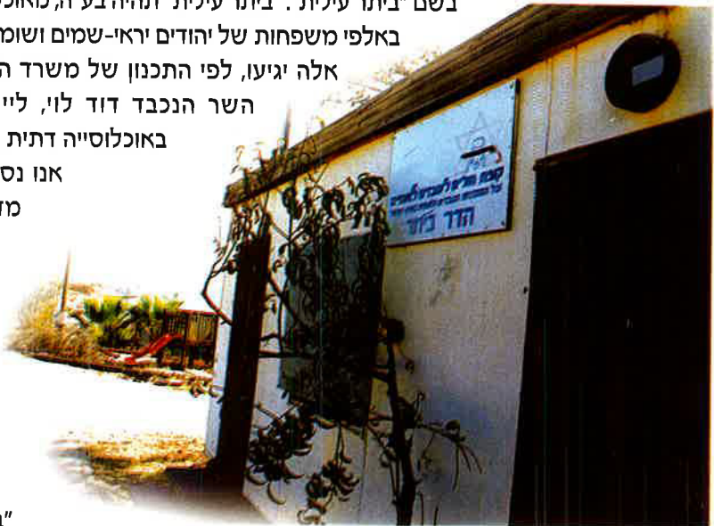
הדר ביתר - מקום צנוע ומתחילתה של שכונה יהודית חדשה צומחת ליד תל אביב Hadar Betar - Modest Beginnings which Grew to a City within 17 Years

אנו נסור מעט בהמשך היום מדרך האבות המובילה לחברון, כדי לראות את המקום בו יתקיים היום אחרי הצהרים טקס הנחת אבן-הפינה לעיר היהודית החדשה, הסמוכה לעיר היהודית העתיקה "ביתר".