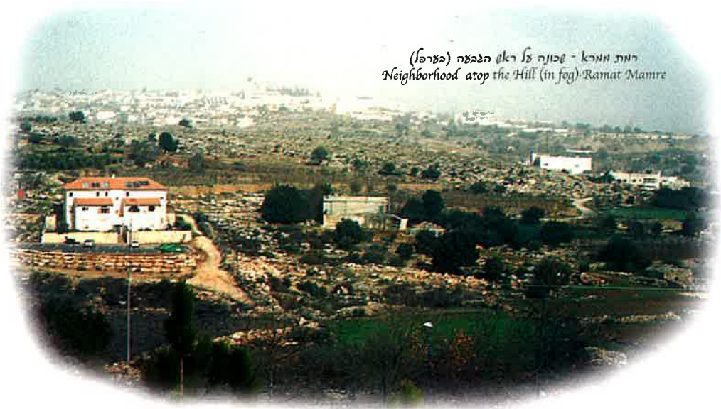
רמת ממרא - שכונה על ראש הגבעה (בארץ) Neighborhood atop the Hill (in fog) - Ramat Mamre

אנחנו נמצאים כעת במרחק קילומטר וחצי מחומותיו של האתר העתיק - אלוני ממרא, ונכנסים אל תוך השכונה היהודית החדשה - "רמת ממרא". בשכונת רמת ממרא חיות היום 300 משפחות יהודיות, כן ירבו, והיא נמצאת בתהליך מואץ של גדילה והתפתחות, לאחר שרק לפני שלוש שנים הונחו היסודות לקבוצת הבתים הראשונה. קבוצת הבתים הזאת מורכבת מבתי דירות דו-קומתיים, היוצרים יחד מלבן גדול מסביב לחצר הפנימית המרכזית.