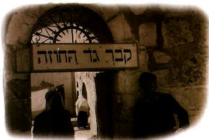
קבר גד החוזה בחלחול Tomb of Gad HaChozeh (the "Seer") in Halhul

שמו של יונה הנביא. המסגד הזה הוא המקום שזוהה, על פי המסורת היהודית, עם קבריהם של נתן הנביא וגד החוזה, ואם נביט שמאלה, מעט מאחורינו, נוכל לראות צריח לבן של מסגד שנבנה לא מזמן. הצריח הזה, ממש בצידו המזרחי של הכביש הראשי, מסמן עבורנו בדיוק את מיקומו של האתר שאליו באו יהודים, לכל אורך ימי הביניים, כדי להשתטח על קברם של נתן הנביא וגד החוזה.