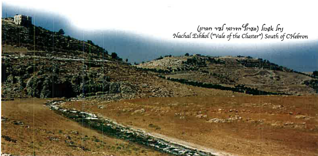
נחל אשכול (בערוץ הדרומי לעיר חברון) Nachal 'Eshkol ("Vale of the Cluster") South of Hebron

אחד של ענבים. למעשה, אם נעיין בהסבר המדרשי נמצא שבעצם היה צורך בשמונה אנשים ולא רק בשניים, כדי לשאת אשכול ענבים אחד בלבד. כל כך גדולים היו אז הענבים. וכאז כן היום - הענבים שגדלים כאן בנחל אשכול הם שופעים וטעימים מאוד מאוד. אנחנו עולים כעת מתוך נחל אשכול ומטפסים אל תוך גבולותיה של העיר חברון החדשה והמורחבת.