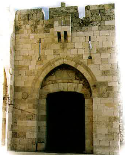
1878 יפו - ירושלים Jaffa Gate, Jerusalem

הדרך הזו, שבה הלך אברהם אבינו נקראת, עקב כך, "דרך האבות". משום שלא רק אברהם, אלא גם יצחק ויעקב אחריו וגם יוסף (כפי שנלמד מאוחר יותר), כאשר נשלח מחברון צפונה כדי לבקש את אחיו, כולם השתמשו באותה הדרך כאשר חיו בארץ ישראל.