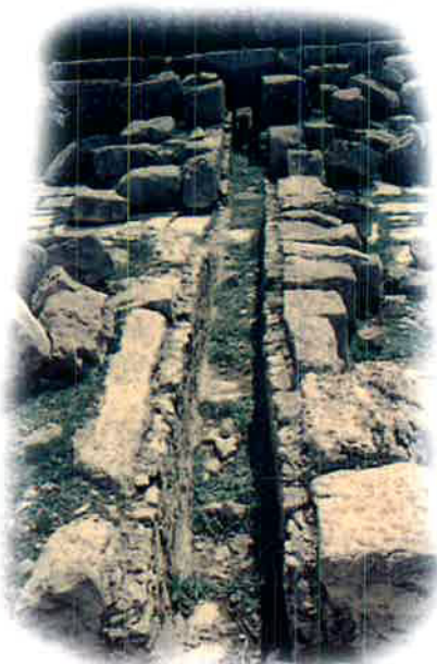
אחת מיס ב"אלוני ממרא" (תמונה ארכיונית) Pipe at 'Elonei Mamre

אם כן, למרות שאי אפשר להגיד באופן מוחלט, ואפילו רחוק מכך, שזהו המזבח שבנה אברהם אבינו כמתואר בספר בראשית. בכל זאת, לאור כל המידע שישנו בדיניו והחומר שאנו רואים כאן מול עינינו, זה בלתי אפשרי עבורי להגיד את ההיפך - שזה באופן וודאי איננו המזבח הזה. מידת האפשרות שזה ייתכן, הסבירות שהמבנה הזה כאן הוא אכן המזבח, שנבנה ע"י אברהם אבינו, היא גבוהה מאד. והדבר הזה ממלא אותנו, יהודים שנמצאים היום בארץ ישראל, בתחושה של חרדת קודש, בהכירנו בזכות הגדולה שנפלה בחלקנו לעמוד בדיוק במקום שבו התגלה הקדוש ברוך הוא לאברהם אבינו.