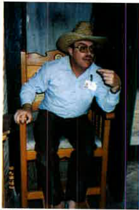
הדרכה בלקבות המקורות בדרך מקוריתו כאן במארת האמפלה Strengthening the Tie between the Nation and the Land of Israel - with Bible in Hand. Here - in Ma'arat Ha'Machpelah.

חסתל צובכ פאמפל צ"י הציור ברוך נחשון The symbol was designed by the artist Baruch Nachshon.