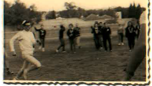
מקום ראשון בתחרות ריצה - מחנה מושבה Chaim (First Place in 100 meters Race) "Camp Moshava"

סיפר אחד החניכים מה שנחרט בזיכרונו, כיצד המשיך המדריך בלהט, בשירה מתלהבת, לאחר שכל הקבוצה כבר הפסיקה.