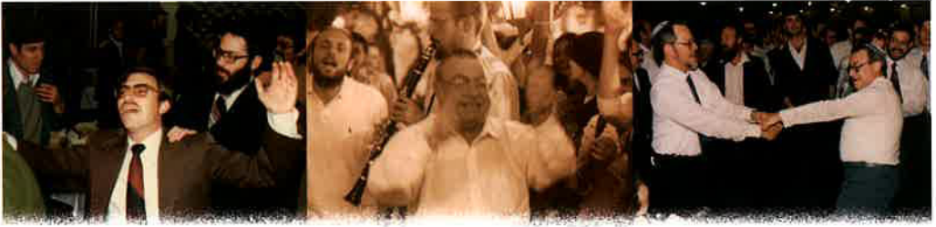
מטאח חתן וכלה