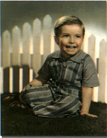
התחלת הדרך - ילדות בניו יורק (בן 3, תש"ח)