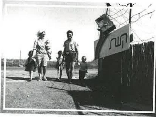
▲ משפחת מגני בקשת, רמת הגולן, קיץ תשל"ד (בזמן ש"י צוי קדן) The Mageni family helps build Keshet (Golan Heights - Summer 5734)

הר' לוינגר אמר בהספדו על אבא ז"ל ליד שכונת "אברהם אבינו", שהוא "שינה את פני ההיסטוריה". פתאום חשבתי לעצמי, הרי מדברים על אדם פרטי ואומרים עליו שבעשייה שהוא היה מעורב בה, הוא שינה את פני ההיסטוריה, וזאת לא הגזמה. העשייה ב"קשת" היא דוגמה