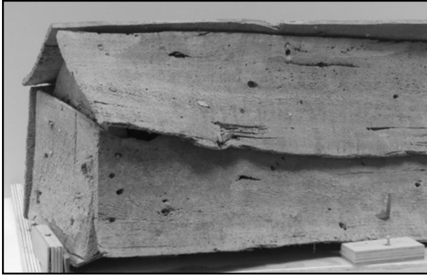
ארון קבורה מעץ שנתגלה באזור עין גדי. היובש באזור המדברי תרם לשימורו הטוב יחסית. עיטורים לארון הקבורה שנעשו בתבנית והם מחרס צבוע