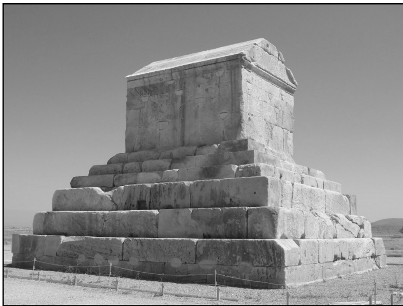
צורת קבר כורש – מקום קבורתו של כורש הגדול, מלך פרס. הקבר מהווה חלק מאתר המורשת העולמית שבפסארגאדה, איראן