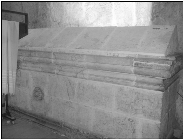
צורת קבר המיוחס לדוד המלך בהר ציון

רצ"ב תמונות קברים וארונות קבורה, שמצאתי 'דרך האתרים'.