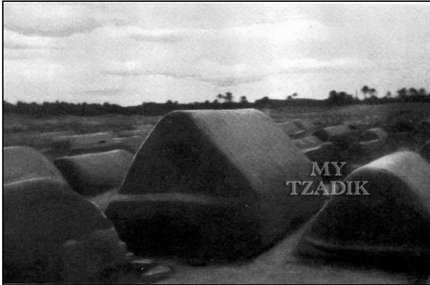
מצבות חמר בבגדאד. באמצע קבר הרב בן איש חי, חכם יוסף חיים (מתוך ספר מסע בבל, עמ' רצא)