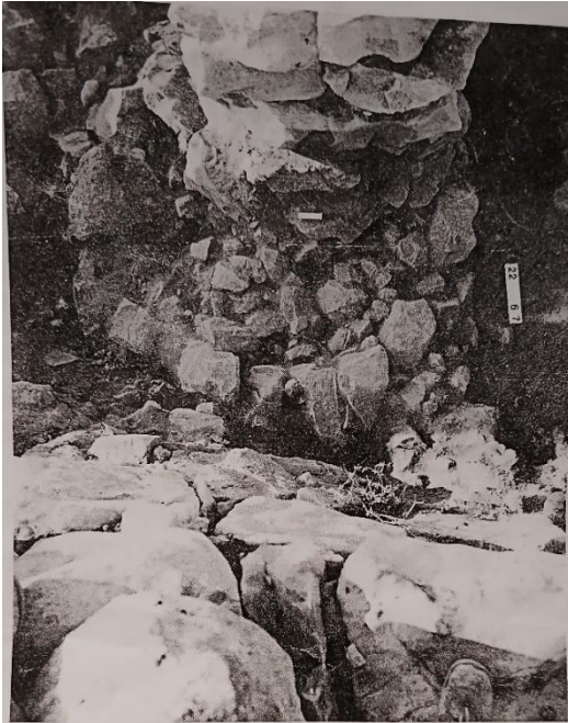
Mt. Ebal: The Circular Installation in the Bottom of the Altar, before Cleaning. It was found full of Ashes and Animal Bones

בתמונה נראה המזבח העגול בעת חשיפתו, ומעליו הקיר הפנימי הארוך של מזבח יהושע. בחלקה התחתון של התמונה נראה הקיר הפנימי השני (שני קירות אלה משורטטים באופן סכמתי בתרשים המזבח שלמטה).