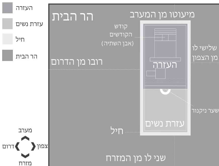
[איור 12] ביאור משנת 'רובו מן הדרום'

נחלקו פרשני המשנה, האם כוונת המשנה לכלול בתוך 'הר הבית' גם את החיל ועזרת נשים, או שהמשנה כוללת רק את השטח הפנוי בהר הבית, ללא החיל ועזרת נשים.