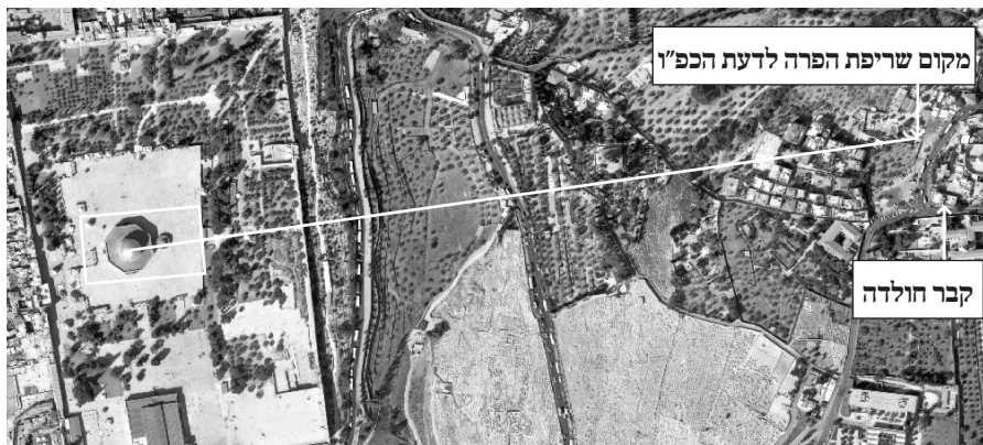
[תמונה 9] מקום שריפת הפרה מכוון מול כיפת הסלע