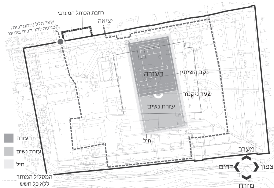
[מפה 10] מקום המקדש על פי השערת הרב גורן

לפנינו מפה בה הצבנו את מקום המקדש העזרות והחיל לפי השערתו של הגר"ש גורן, בה ניתן לראות כי גם לשיטת הגר"ש גורן יש מקום נרחב לעבור במערב ללא חשש, כאשר נצמדים לכותל המערבי. 16