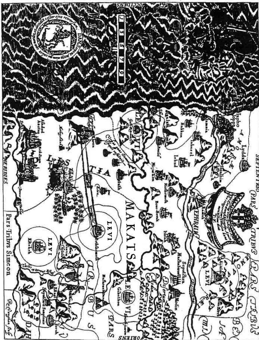
מפה מס' 3: מפה של נחלת שבט דן, משנת 1650 (לוריון) (מעניין איתורה של מקץ, שהיא חבל גדול מדרום לירקון, במפה עתיקה זו)