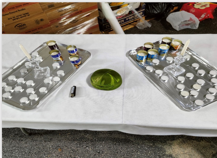
עמדת הדלקת נרות שבת קודש בחדר אוכל בקדמית 551 (חסון תשפ"ה)