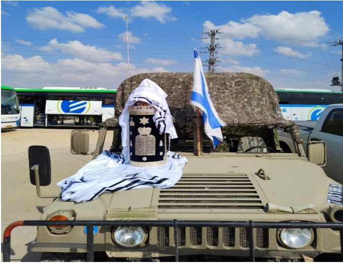
”ויהי בנסוע הארון” - ספר התורה בדרך לחיילי ישראל “בכל מקום שהם”