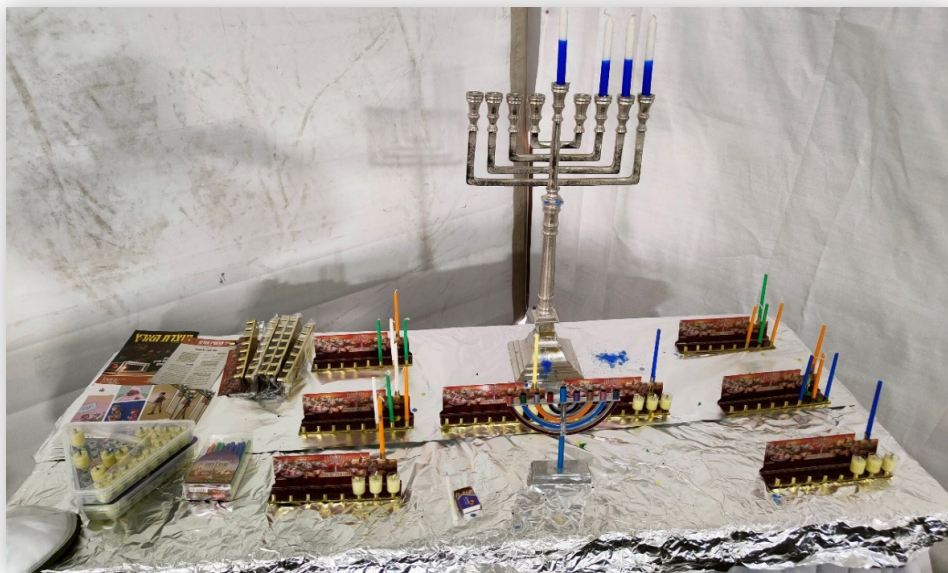
עמדת הדלקת נרות חנוכה בחדר אוכל בקדמית 551 (חנוכה תשפ"ה)