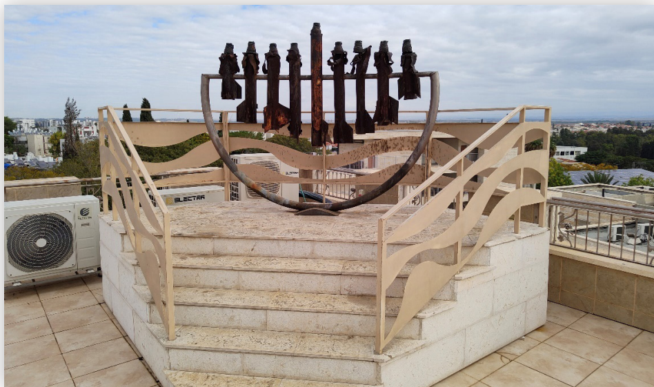
חנוכיית הקסאמים על גג ישיבת שדרות