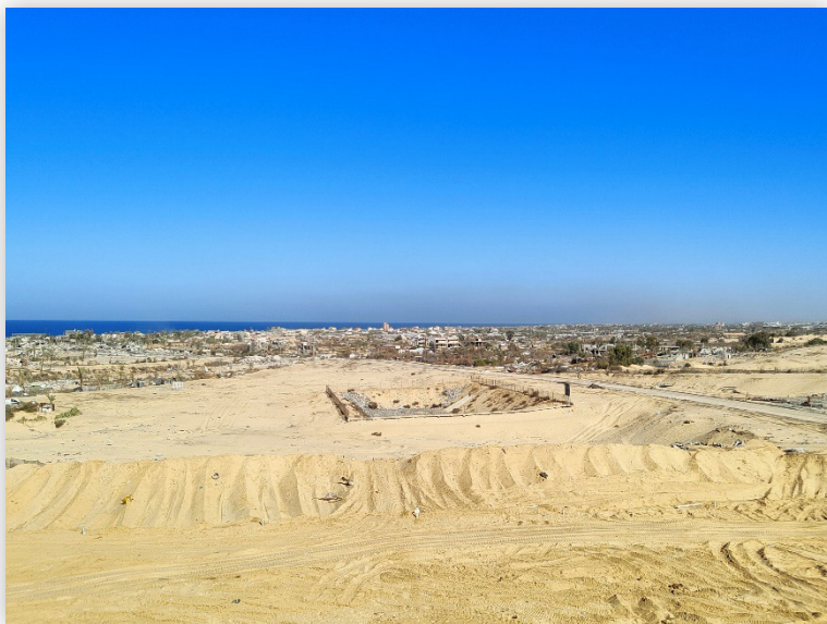
חוף רפיח תובב"א - "לְאַחַז בְּכַנְפוֹת הָאָרֶץ וַיִּנְעֲרוּ רְשָׁעִים מִמֶּנֶּה" (איוב לח, יג)