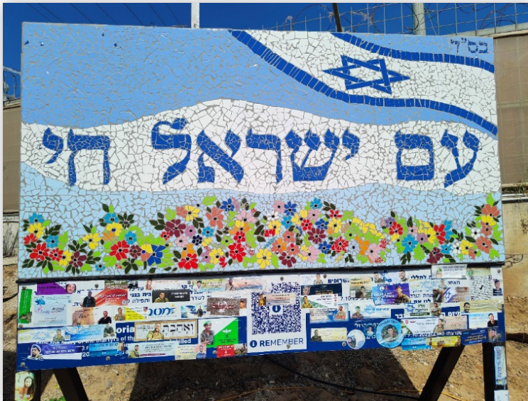
עם ישראל חי - בכניסה למגרש המכוניות השרופות בכביש 232 (עוטף עזה)