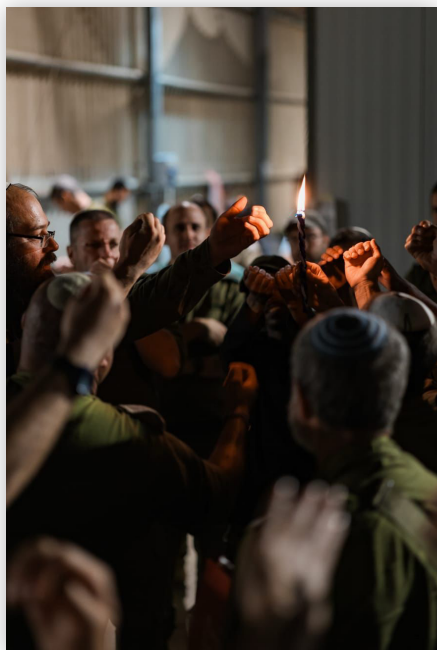
"המבדיל בין אור לחושך... בין ישראל לעמים" - הבדלה בקדמית חטיבת "חיצי האש" (551), מוצאי שבת קודש פרשת נח (וי חשון תשפ"ד)