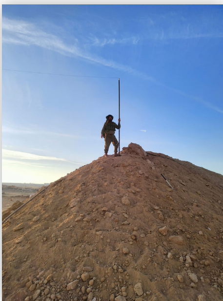
עירובין במוצב צה״ל בציר נצרים (חשון תשפ״ה)