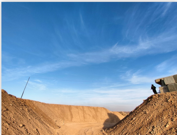
"צורת הפתח" לעירוב שבת בשג אחורי במוצב צה"ל בפרוזדור נצרים