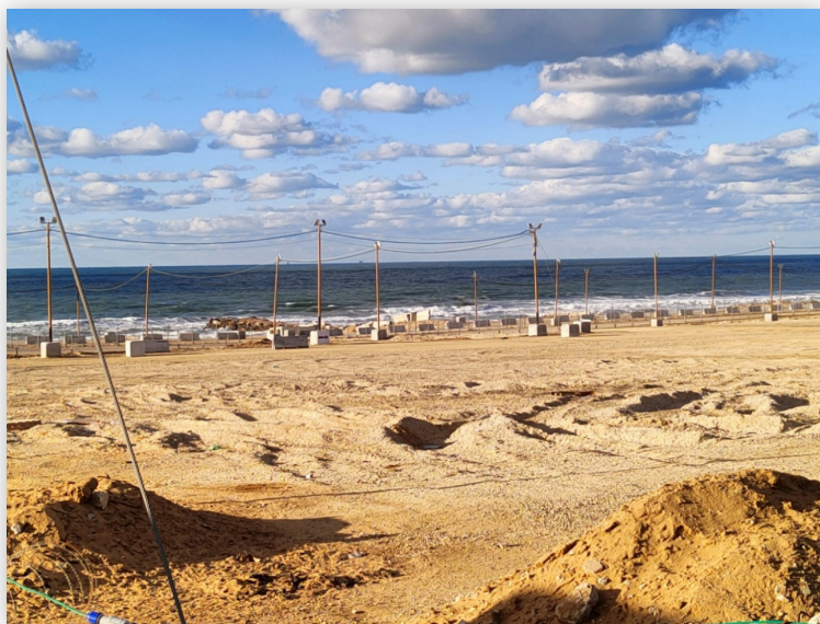
חוף הים הנושק למוצב צה”ל בציר נצרים - ”עוד אבנך ונבנית”