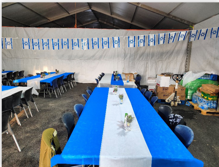
אוהל חדר אוכל בקדמית 551 - לקראת שבת קודש (חסון תשפ"ה)