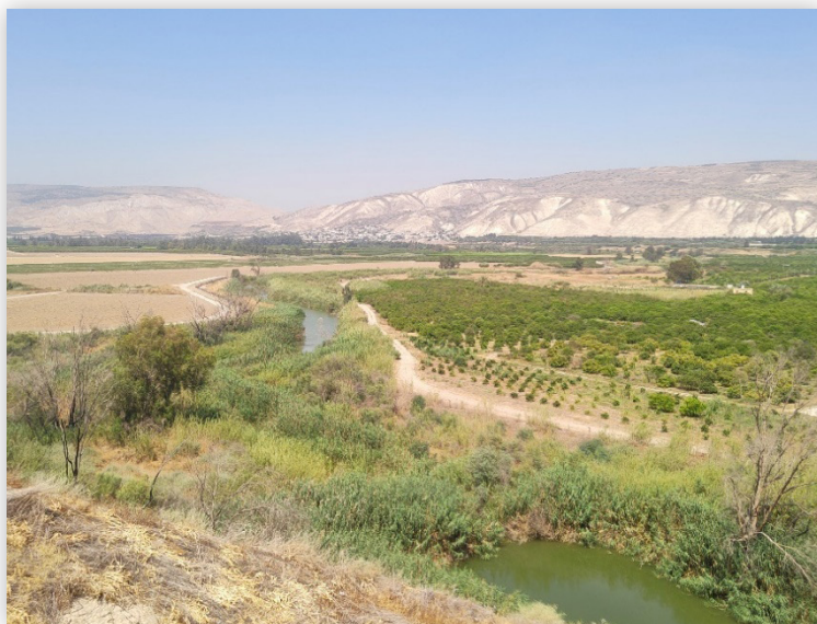
נהר הירדן וגדר הגבול המזרחית בתצפית מאחד ממוצבי "קו המים" המשוקמים בבקעת הירדן (סיוון תשפ"ה)