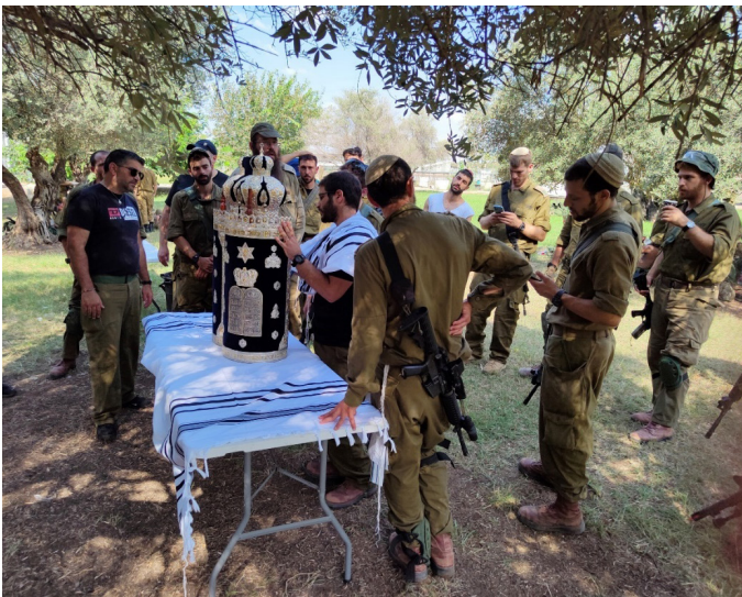
קריאה בתורה בשטח עם חיילי גדוד 7008 (כ”ז תשרי תשפ”ד - חמישה ימים לאחר פרוץ המלחמה)