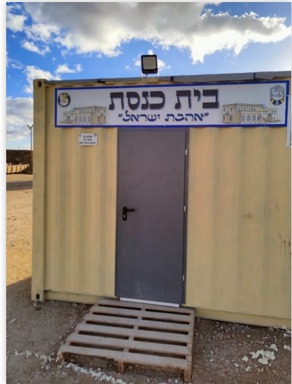
בית הכנסת במוצב צה"ל בציר נצרים בקרבת הישוב נצרים יובב"א