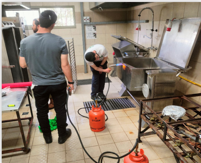
מבצע פסח תשפ"ה - הכשרת המטבח וחדר האוכל במפקדת חטיבת "כפיר"