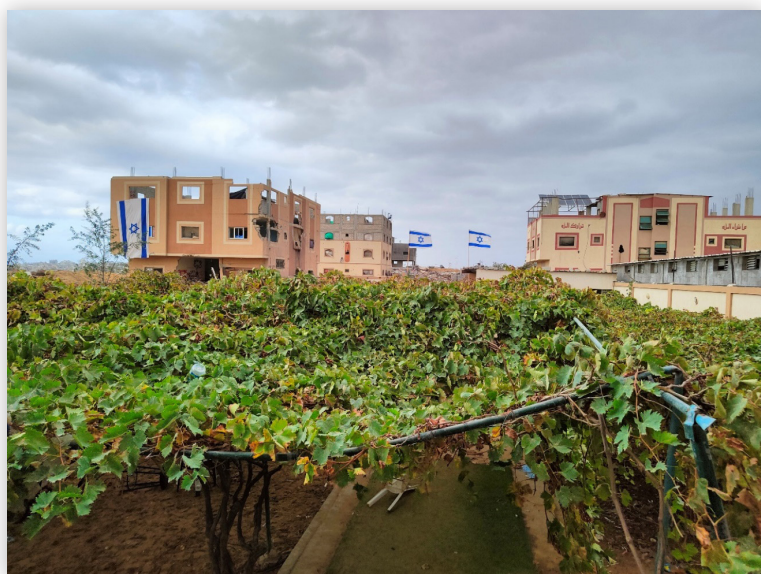
”אל תחת גפן ואל תחת תאנה” (זכריה ג, י) - מוצב בציר נצרים