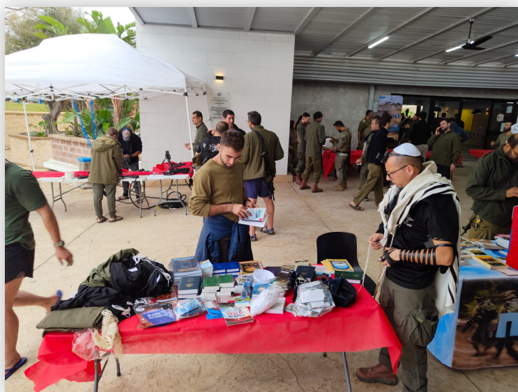
חייל מניח תפילין בעמדת רבנות החטיבה בעת ריענון יציאה מעזה - כפר הנופש באשקלון (י"ד בכסלו תשפ"ד)