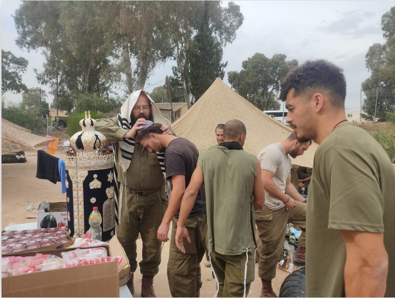
י"ד חשון תשפ"ד, גדס"ר 6551 מעמד ברכת כוהנים לפני יציאה להתקפה קרקעית בבית חאנון