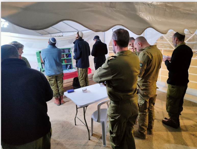
תפילה במניין באוהל בית הכנסת בקדמת 551 (כסלו תשפ"ד)