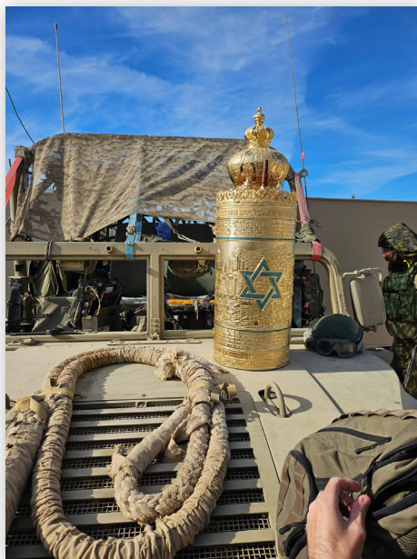
הכנסת ספר־תורה מהודר שנתרם ע״י קהילה חשובה בצפון ת״א - למוצב צה״ל בציר נצרים (חשון תשפ״ה)