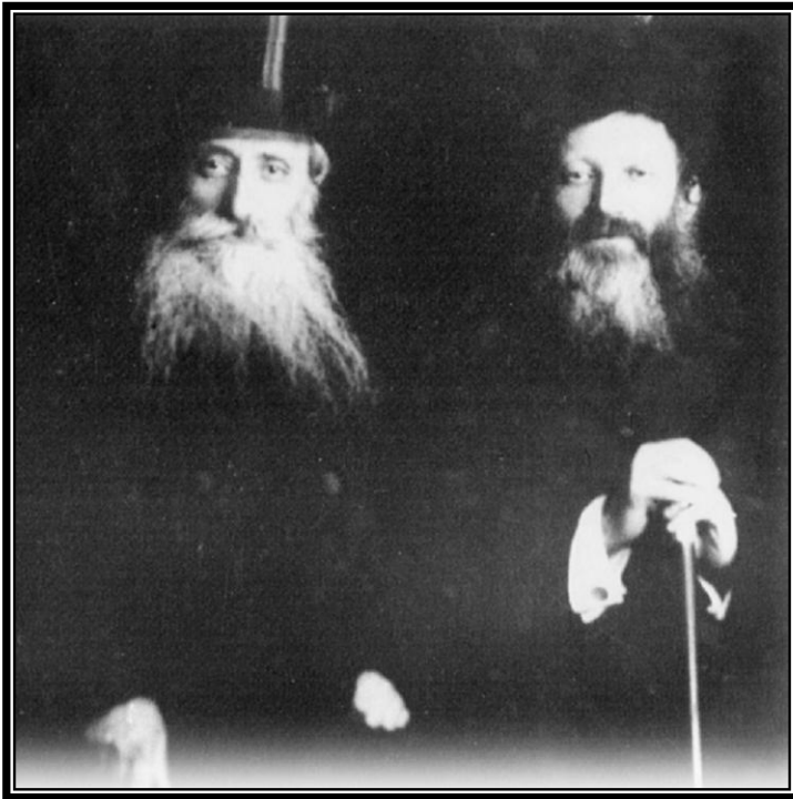
במסעם המשותף לאמריקה