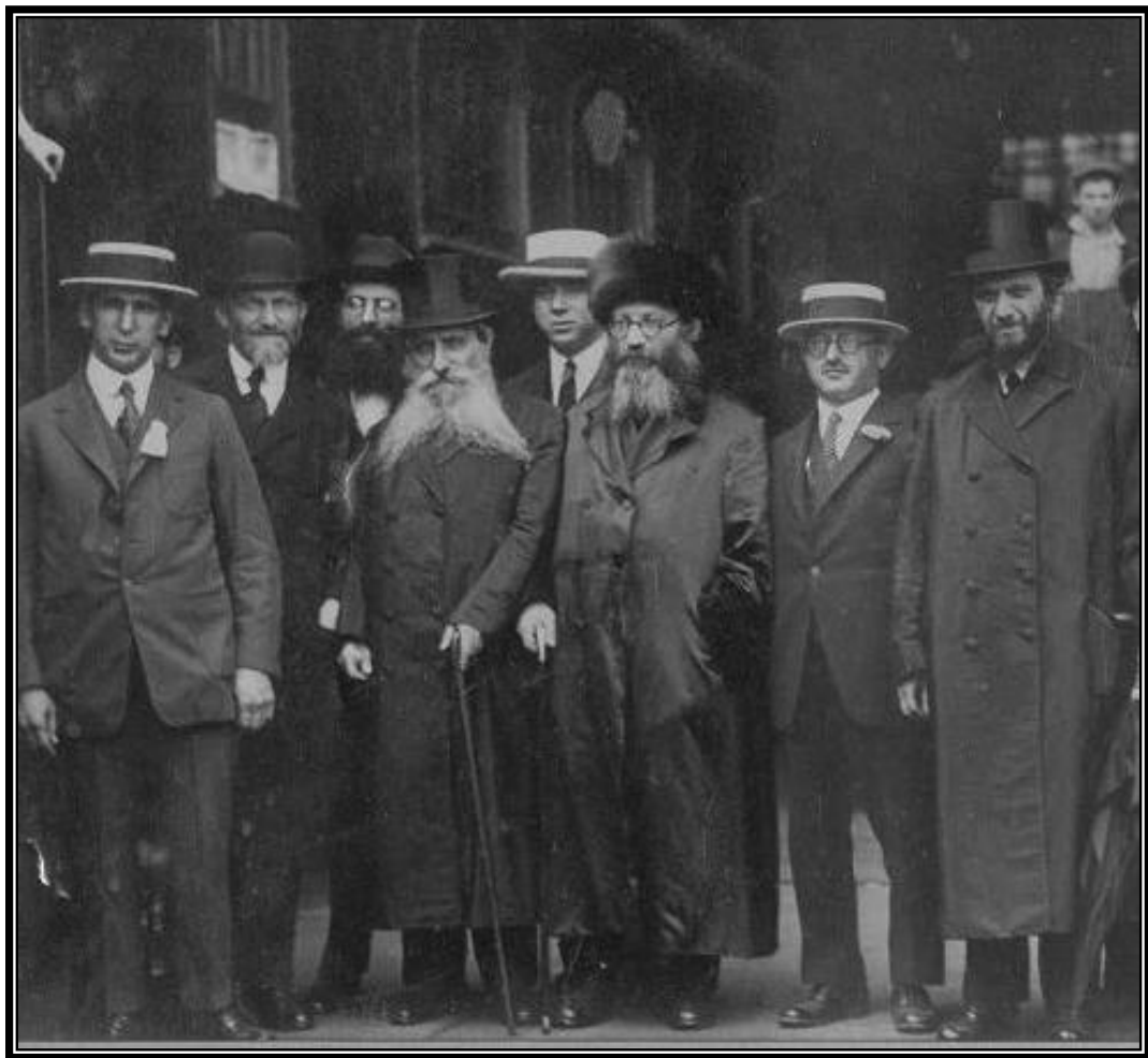
במסע הרבנים לאמריקה