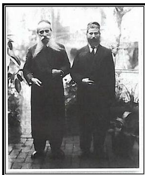
הגרא"ד, במסע לאמריקה עם הרה"ג רבי אליעזר סילבר