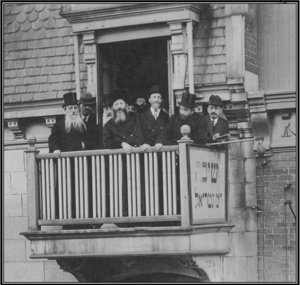
הגראי"ה, הגרא"ד הגרמ"מ על גזוזטרה בישיבת מונטריאול [הראי"ה נואם בפני הקהל הנמצא למטה]