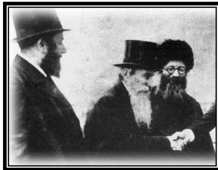
הראי"ה זצ"ל, הגרא"ד שפירא זצ"ל, הגרמ"מ אפשטיין זצ"ל