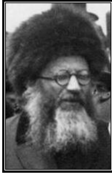
הגרא"י הכהן קוק זצ"ל