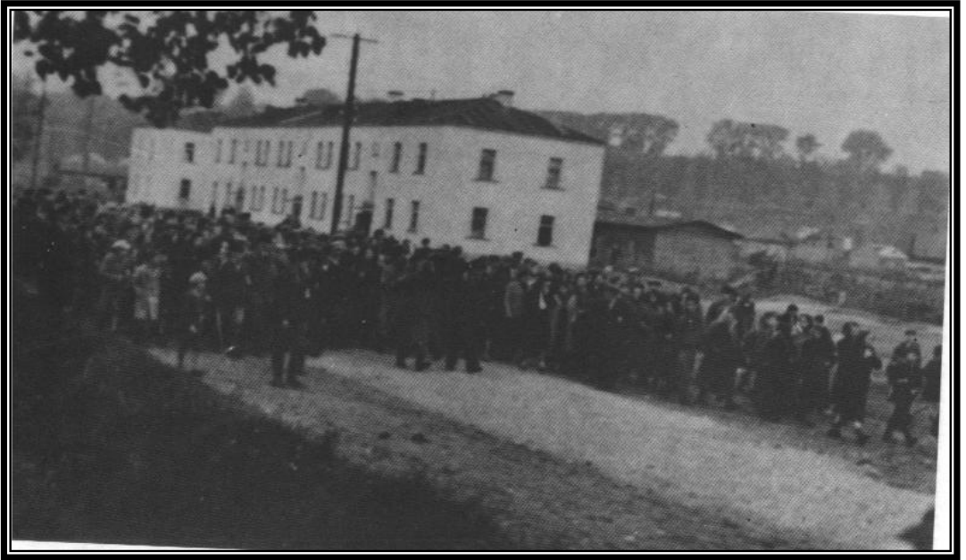
לויית הגרא"ד שפירא זצ"ל הי"ד בגטו קובנה