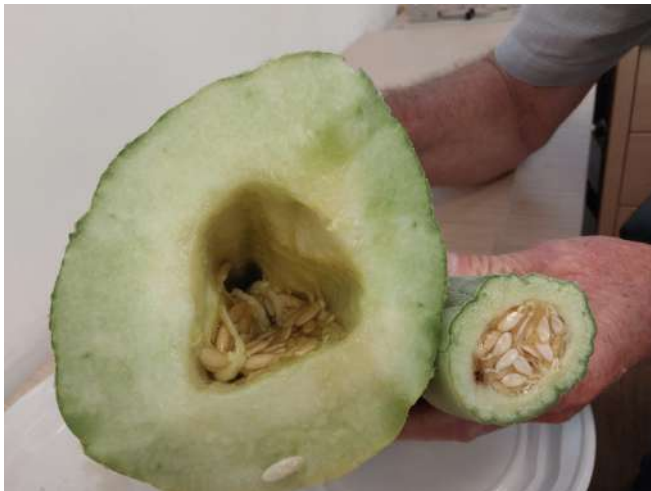
« תמונה מס' 2 - חתך רוחב בפרי צעיר (בצד ימין) ובפרי בוגר (בצד שמאל) לאחר הוצאת רוב הזרעים הבשלים

לאחר מבחן טעימה שנערך במכון סוכם על דעת הרב יהודה עמיחי שליט"א כי מלפפון הפקוס הוא מלון.