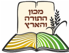
כפר דרום ת"ו - ניצן