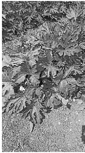
צימוח שיחי של דלעת ערמונים

(ב) ניקוד כסף: בחלק מהמינים ישנו מופע של הכספה בפני העלה. תכונה זו קיימת בכנות הדלעת המקובלות, בחלק מהקישואים, ובדלעות שונות. (ג) צימוח שיחי או שרוע מתפשט: חלק ממיני הדלועים, ורוב המינים המסחריים בארץ, גדלים בצורה שרועה מתפשטת - מלפפון, אבטיח, מלון, דלורית וכן כנות הדלעת הנפוצות. מינים אחרים גדלים כשיח - כלומר ענפים רבים היוצאים כלפי מעלה מהמרכז. ביניהם ניתן לציין את מרבית הקישואים, דלעת ערמונים ועוד. תכונה זו משפיעה על הגדרת המינים ביחס להרחקות הנדרשות בכלאי זרעים. צמחים משתרעים ממשפחת הדלועיים צריכים הרחקה גדולה של שתי אמות (96 ס"מ) מצמחי ירקות אחרים, 16 שלא כצמחים שיחיים ממשפחת הדלועיים כדוגמת הקישוא. 17 המציאות בה ישנם מינים שדומים בצורתם, אך שונים בתכונה זו, מעלה שאלה האם דבר זה ישפיע על הגדרת המין שלהם (ראה תמונות 1-2 בכריכה האחורית).