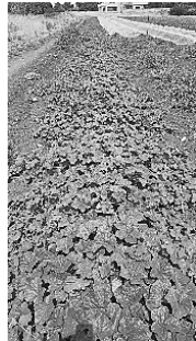
צימוח מתפשט של מלון

(ד) צורת הפרי בדלעות: המראה של פירות שונים הקרויים דלעת, שונה מאוד בצורה, בגודל, בצבע ובמרקם. באנגלית ישנם ביטויים נפרדים לסוגי פרי שונים, וחלוקות שונות בתוך קבוצת הדלעות: Pumpkins: דלעות עגולות (יכול להיות מינים שונים) Squash: דלעות לא עגולות (מוארכות) או קישואים.