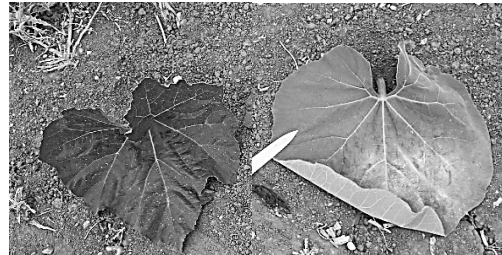
עלה דלעת הבקבוק (קרא) מימין, עלה דלעת נאפולי משמאל

קבוצה 4: דלעות שיחיות: דלעות אלו משתייכות כמעט כולן למין הבוטני pepo. הן שונות משמעותית מדלעות אחרות גם במופע העלים וגם במופע הפרי. גם קבוצה זו ניתן לחלק למספר תתי קבוצות: