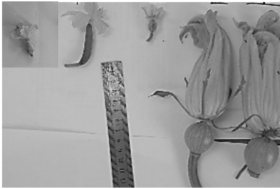
פרחים נקביים של מינים ממשפחת הדלועיים: מימין שני פרחים של כנות דלעת, אבטיח, מלפפון ומלון. בהמשך הגידול, החלק התחתון מתפתח ומהווה את הפרי

ישנם מאפיינים כללים שנכונים לכלל צמחי משפחת הדלועיים, או לרובם הגדול. מאפיינים אלו כוללים מספר תכונות. ראשית, מאופיינים הצמחים ממשפחה זו בצימוח נמרץ ומהיר. בנוסף, בדרך כלל יהיו לפרחים עלי כותרת צהובים, ברוב המקרים גדולים. תכונה מעניינת במשפחה זו, היא שהפרי הנקבי מתפתח כפרי קטן ועליו עלי כותרת צהובים. לכן, ניתן לראות בדרך כלל כבר בשלב הפריחה והחנטה, את צורתו הכללית של הפרי. 15 בנוסף, הפריחה היא של פרחים זכריים ונקביים בנפרד. ברוב המקרים