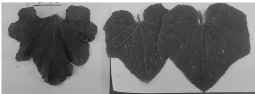
עלים של שני זני מלפפון מימין (נענע וקניגסטאר), בהשוואה לעלה מלון (פרלינה) משמאל. עלה המלון פחות מחודד למטה, ובנוסף מקופל באופן שקשה ליישר אותו (ניכר בתמונה), אולם בשדה ובמציאות מופע העלים דומה יותר ממה שניכר בתמונה

למרות השונות הרבה, ניתן לחלק את הדלועיים למספר קבוצות לפי תכונות כלליות אשר עשויות לסייע בהגדרת חלוקת המינים לפי ההלכה. התמונות המצורפות באות לסייע להבנה, אך מטבע הדברים לא תמיד ניתן להבין מהן את המציאות במלואה. (א) צורת העלה: העלה נראה לעיתים עם מופע מצולע - עלים שלמים בגדלים שונים: במלון ובמלפפון - העלה מצולע אך קטן, ובחלק מהדלעות יש מופע דומה אך בעלים גדולים. לעומת זאת ישנו מופע מפורץ/מאוצבע כפי שיש באבטיח שהעלה לא שלם אלא גזור. עלה מפורץ, אך שונה במראהו וגדול בהרבה, ישנו גם לקישואים ולחלק מהדלעות - דלעת ערמונים ודלעות מהמין pepo.