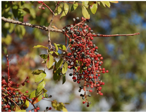
אלה ארץ ישראלית

■ אלה ארץ-ישראלית ( Pistacia palaestina ) - מעצי החורש הנפוצים בארץ, יחד עם האלון המצוי. נפוץ כעץ קטן או כשיח גדול, אך כאשר אינו סובל מכריתה ורעייה עשוי להתפתח לעץ גדול בעל נוף רחב. כך מזהים רס"ג (בתפסיר), רב נתן אב הישיבה ותנחום הירושלמי. 1