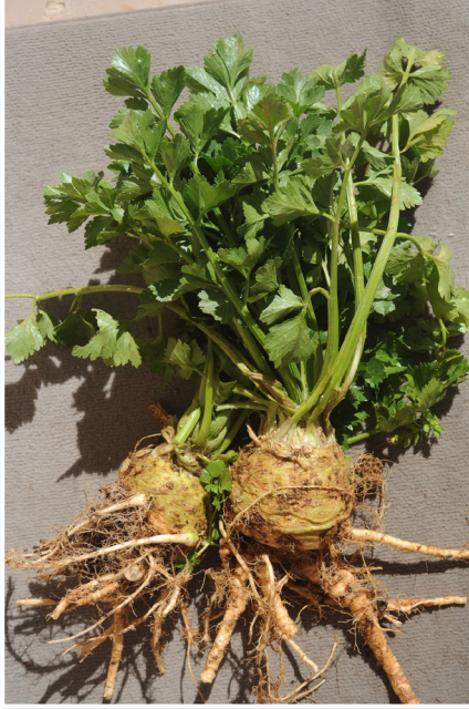
כרפס - סלרי

הכרפס נזכר במשנה פעם אחת, כאחד מצמחי הבר הפטורים ממעשרות ומדיני