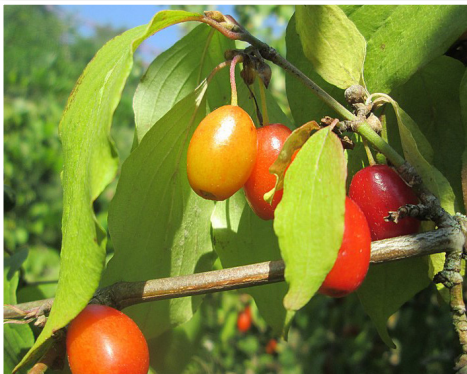
קרנית נאכלת ('דובדבן קורנלי')