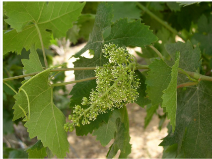
גפן - פריחה