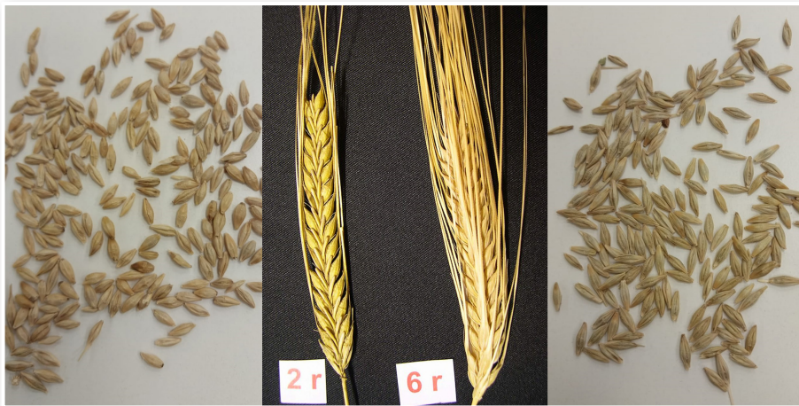
שעורה שש טורית ודו טורית

שעורה תרבותית ( Hordeum vulgare ) הינה מין דגן נפוץ ועתיק יומין, אשר בוית בתקופות קדומות. באזורנו נחשבה השעורה כפחותה באיכותה ובחשיבותה יחסית לחיטה. גרעיני השעורה מכילים אחוז נמוך של גלוטן יחסית לחיטה, ואחוז גבוה של