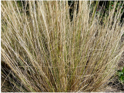
צמח פשתן לפני הקציר

פשתה תרבותית ( Linum usitatissimum ) היא צמח עשבוני גבוה, המשמש בתעשיית הטקסטיל. סיבי הפשתן מצויים בקליפת הגבעולים הגבוהים של הצמח, והם מופרדים מהם, מיובשים, ועוברים תהליך של ריכוך וניקוי לקראת הטווייה והאריגה. הפשתן היה בעבר מן הגידולים החשובים ברחבי הסהר הפורה, במיוחד במצרים העתיקה, ולצד הצמר היה הפשתן חומר הגלם המרכזי לייצור בדים באזורנו בעת העתיקה. בארץ ישראל גידלו את הפשתן, המותאם לאזורים חמים ולחים, ככל הנראה בעמקי המזרח.